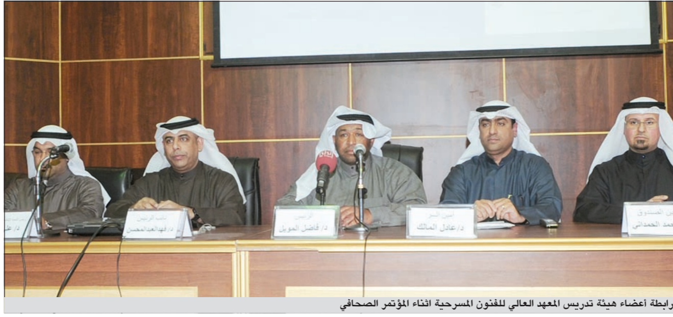
رابطة أعضاء هيئة تدريس المعهد العالي للفنون المسرحية أثناء المؤتمر الصحفي

وكان مقررا عرض الفيلم في الصالات اللبنانية 19 يناير المقبل، وتدور قصته حول لبناني شبيعي يقول إنه يمتلك قرصا مدمجا يتضمن معلومات مهمة للغاية عن قضية اغتيال الرئيس رفيق الحريري، ويعرض الرجل معلوماته على المخابرات الفرنسية في بيروت في مقابل منحه حق اللجوء السياسي في فرنسا، ولكن الفرنسيين لا يبدون اهتماما لهذا الأمر، ما يحمل الرئيس دارين حمزة خدماته على شعبة المعلومات في قوى الأمن الداخلي، ولكن الشبهة لم تبد أي اهتمام هي الأخرى، ويتضمن الفيلم قصة حب ملتصقة بين فتاة لبنانية وشاب فرنسي قبل أن تكتشف أن الشاب يعمل جاسوسا. هذا وعبرت المخرجة اللبنانية دانيال عريبد عن غضبها من منعه العرض، وقالت في صفحتها على «فيسبوك» إنها لن تستسلم، وستناضل من أجل عرض الفيلم في الصالات اللبنانية، أو ستوقف نهائيا عن إخراج أي فيلم لبناني آخر، وأضافت أنها ليست المرة الأولى التي يمنع فيها فيلم في لبنان.