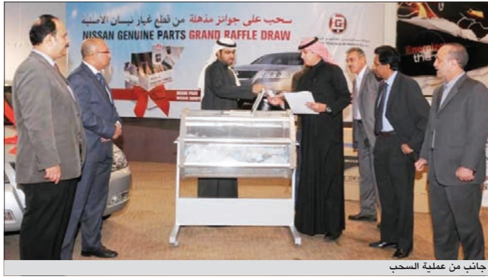
جانب من عملية السحب