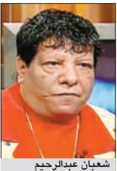
شعبان عبد الرحيم

نظرا لإيمانه بأن حياته مليئة باللحظات المؤثرة التي يجب أن تظهر للمجهور، أعلن المطرب الشعبي شعبان عبد الرحيم أنه سيقدم برنامجا جديدا يتناول قصة حياته على القناة الجديدة التي تحمل اسمه والتي ينوي إطلاقها قريبا. وأكد شعبان، بحسب موقع «عيون ع الفن»، أن البرنامج سيكون مثل