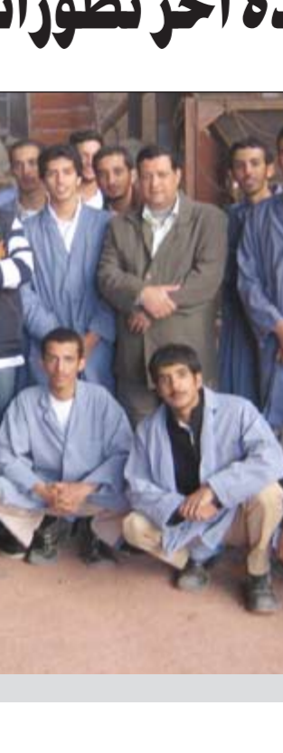
الطلبة خلال الزيارة

قام طلبة التدريب الميداني في معهد التدريب الإنشائي بزيارة ميدانية لمصنع أبراج الكويت للبلاط والطابوق. وأكد مدير معهد التدريب الإنشائي علي الخميس أن الزيارات الميدانية تعد جزءا لا يتجزأ من العملية التدريبية، وذلك حرصا على توطيد العلاقة مع سوق العمل سعيا لتحقيق أهداف الهيئة العامة للتعليم التطبيقي، وذلك لما يحتاجه سوق العمل من الكوادر الوطنية الشابحة لمعهد التدريب الإنشائي، والتي تعتبر جل السنة التدريبية، وذلك عند النزول إلى أرض الواقع مشاهدة آخر تطورات الساحة الإنشائية. وأوضح م.الخميس أن أسرة