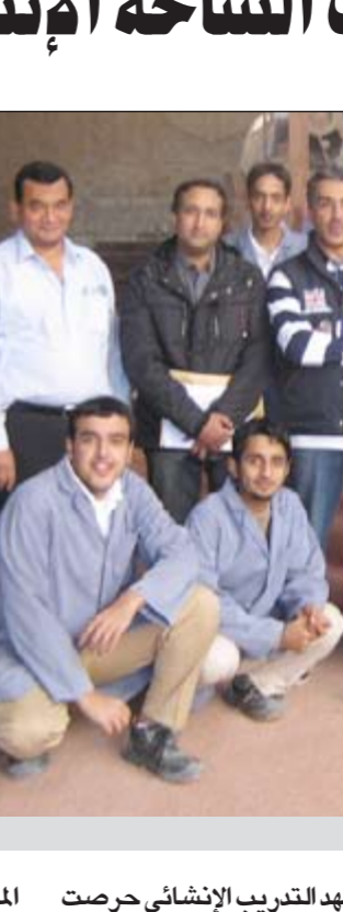
الطلبة خلال الزيارة