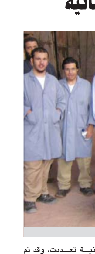
الطلبة خلال الزيارة