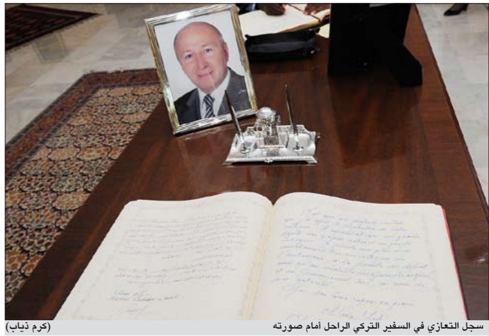
سجل التعازي في السفير التركي الراحل أمام صورته

وأوضح أن مجلس إدارة نقابة وزارة الإعلام يحرص على متابعة قضايا العاملين في وزارة الإعلام بعد إنجازها وتفتيها، لافتاً إلى أن النقابة ستقدم لحد تشكيل الحكومة الجديدة وبعد انتخابات الأمة 2012 بعدد من المشاريع التي ستخدم العاملين في الوزارة وترتقي بهم، حيث قطع مجلس إدارة النقابة شوطاً في تحقيقها مع قيادة وزارة الإعلام التي أبدت استعدادها لدعم هذه المشاريع.