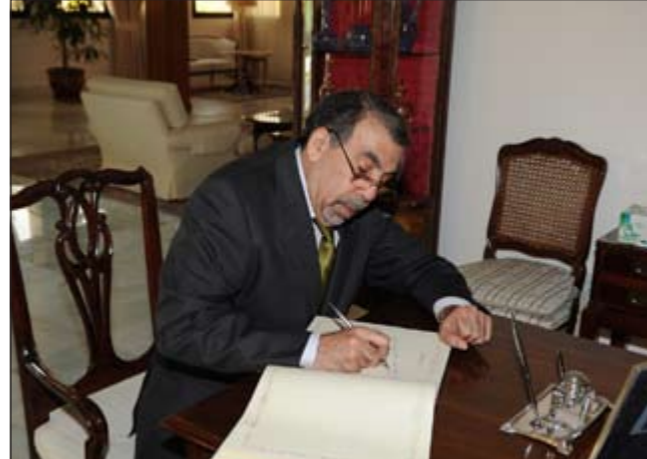
... والسفير البوسني يعزي

فتحت السفارة التركية أمس أبوابها لاستقبال المعزين بوفاة السفير التركي حلمي دادا أوغلو، حيث توافد كبار الشخصيات والمسؤولين في الكويت وأعضاء السلك الدبلوماسي إلى مقر السفارة في الدعية لتقديم واجب العزاء وكان من بين الحضور السفيرة الفرنسية ندى يافي التي قالت لـ «الإنباء» أن وفاة السفير التركي اثر في نفسها، مشيرة إلى أنه كان شخصية محترمة ومحبة بين أعضاء السلك الدبلوماسي، كما أنه خير ممثل لبلده متمنية لأهله الصبر والسلوان.