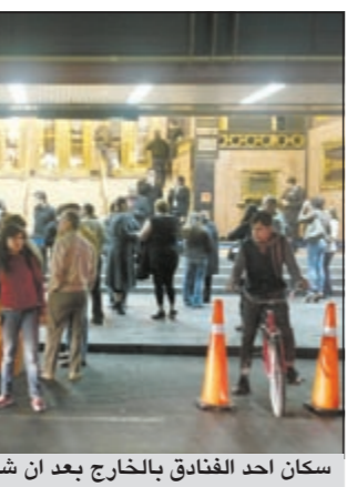
سكان احد الفنادق بالخارج بعد ان شعروا بالزلزال