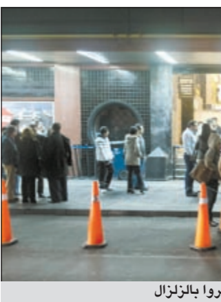
سكان احد الفنادق بالخارج بعد ان شعروا بالزلزال