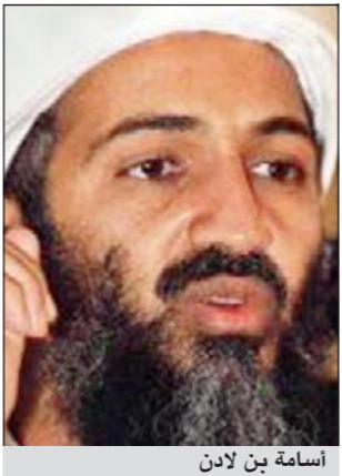
أسامة بن لادن

لكن حتى مع وضع الباحثين لذلك في الاعتبار فإن تعاطي أدوية متنوعة في نفس الوقت يمثل عاملا مشتركا في زيادة احتمالات الإصابة بالعجز الجنسي. واعتمدت النتائج على استطلاع أجري فيه 37712 رجلا تتراوح أعمارهم بين 45 و69 عاما. وقال 29٪ منهم أنهم يعانون من خلل متوسط أو حاد في عملية الانتصاب. وكان أكثر من نصف الرجال يتعاطون أكثر من ثلاثة أنواع من الادوية يوميا طوال العام الماضي. وكما كان متوقعا كان المصابون بارتفاع نسبة الكولسترول وارتفاع ضغط الدم والسكري او الاكتئاب أكثر تعاطيا لادوية.