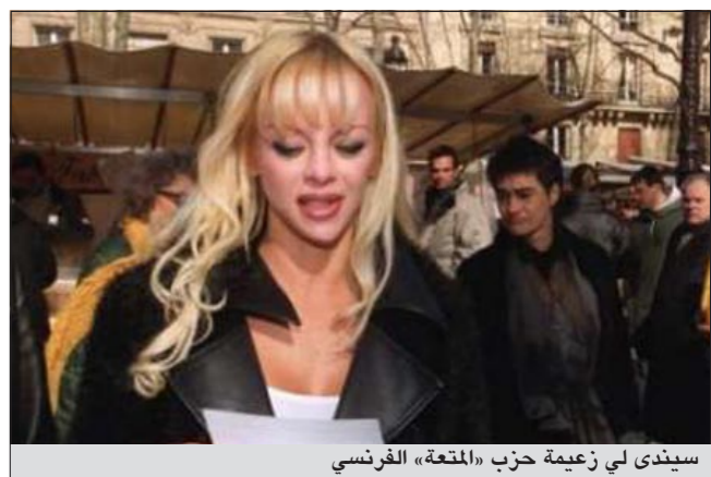
سيندي لي زعيمة حزب «المتعة» الفرنسي