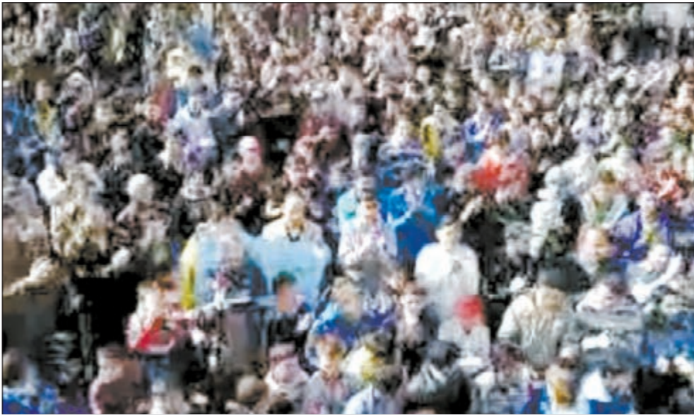
صورة بثها ناشطون على الإنترنت لمظاهرة في بلدة ناحتة في درعا امس