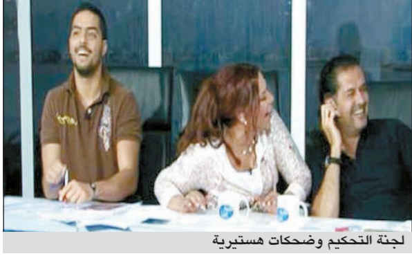
لجنة التحكيم وضحكات مستيرية