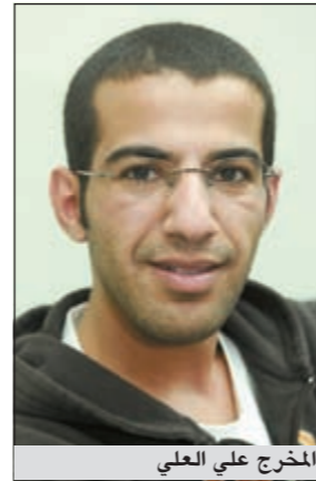
المخرج علي العلي