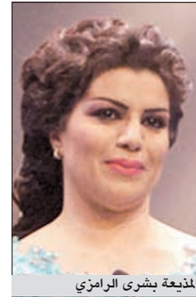
المذيعة بشرى الرامزي