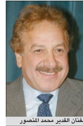
الفنان القدير محمد المنصور