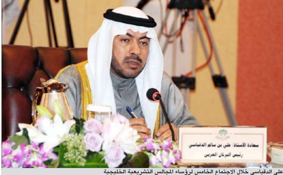
علي القديسي خلال الاجتماع الخامس لرؤساء المجالس التشريعية الخليجية

الإبادة الجماعية التي يتعرض لها حاليا، كما دعا جامعة الدول العربية إلى حسم موقفها من سياسة الماطلة والتسويق والتهم التي يتبعها النظام السوري. وأضاف: رئيس البرلمان العربي، أنه من المتوقع أن يلتقي وفد البرلمان العربي المشارك في الاجتماع الخامس مع صاحب السمو الملكي الأمير خالد بن فيصل بن عبدالعزيز آل سعود أمير منطقة مكة المكرمة، لبحث ومناقشة الندوة التي يزمع البرلمان العربي عقدها بالتعاون والتنسيق مع جامعة الدول العربية، حول استشراف مستقبل العلاقات العربية-العربية في سياق ثورات الربيع العربي. وفي رده على أحد الأسئلة حول وضعيته كرئيس للبرلمان العربي وهل تتناقض أو تعارض مع قرار حل مجلس الأمة الكويتي، أجاب القديسي أنه لا يوجد أي تعارض أو تناقض بين ممارسة مهامه كرئيس للبرلمان العربي وبين حل مجلس الأمة، حيث أن الإجراءات التي اتخذها البرلمان العربي بشأنه، هي حالة حل البرلمان الوطني الذي ينتمي إليه العضو تستمر العضوية في البرلمان إلى حين إجراء الانتخابات البرلمانية الوطنية. وأضاف أن الهدف من التأكيد على هذا النص في النظام الداخلي للبرلمان العربي هو عدم إبعاد «فراغ دستوري» لعضو البرلمان العربي الممثل لدولته في البرلمان العربي.