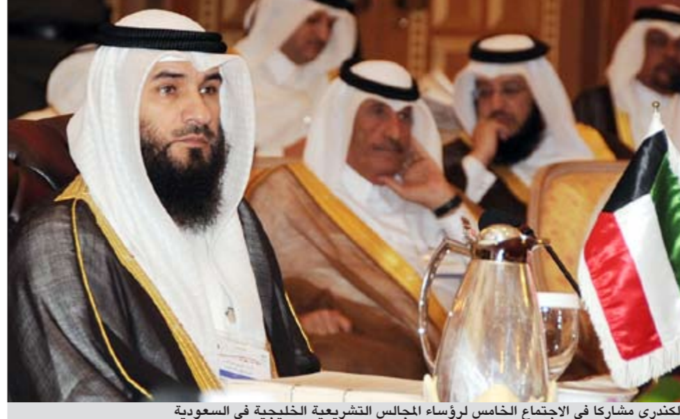
الكندري مشاركة في الاجتماع الخامس لرؤساء المجالس التشريعية الخليجية في السعودية

بحسب قواعد التنظيمية تهدف التي تعميق الروابط والصلات والتعاون لدول الخليج العربية. كما تهدف إلى تعزيز التعاون وتوثيق الروابط والصلات بين المجالس ومؤسسات المجتمع المدني في دول مجلس التعاون والسعي لوضع تشريعات متماثلة في مختلف المجالات لتحقيق أهداف مجلس التعاون لدول الخليج العربية. وتوجه الأمين العام لمجلس الأمة الكويتي في ختام تصريحه بالشكر لمجلس الشورى السعودي على حفاوة الاستقبال وكرم الضيافة معرباً عن اعترازه بالمشاركة في