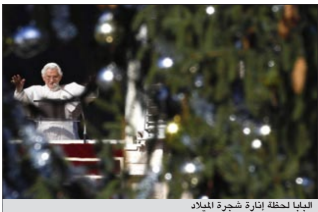
البابا لحظة إنارة شجرة الميلاد

مترا وعرضها البالغ 450 مترا. وهي مؤلفة من مئات اللمبات وتقع على تلة بالقرب من مدينة غوبسو التي تعود إلى القرون الوسطى. وقد نقل الحفل مباشرة إلى القناة الرسمية «راي». ويشار إلى أن البابا بنديكتوس السادس عشر يؤيد استخدام التكنولوجيا الجديدة في الفاتيكان وهو بعث بأول رسالة قصيرة له على «تويتر» في يونيو الماضي.