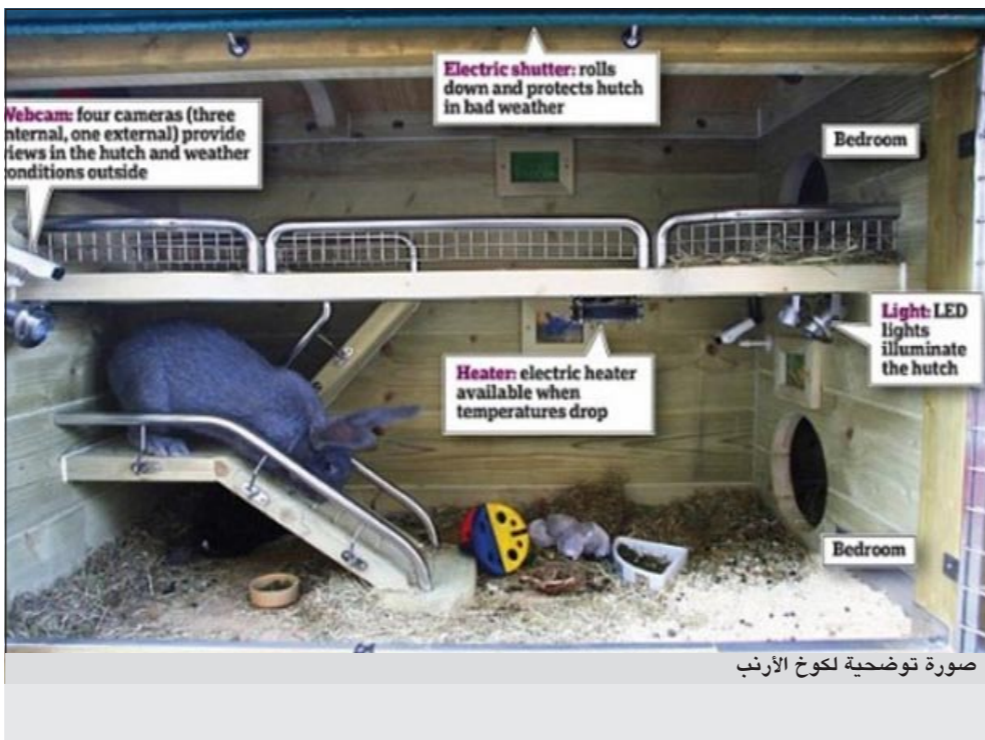
صورة توضيحية لكوخ الأرنب