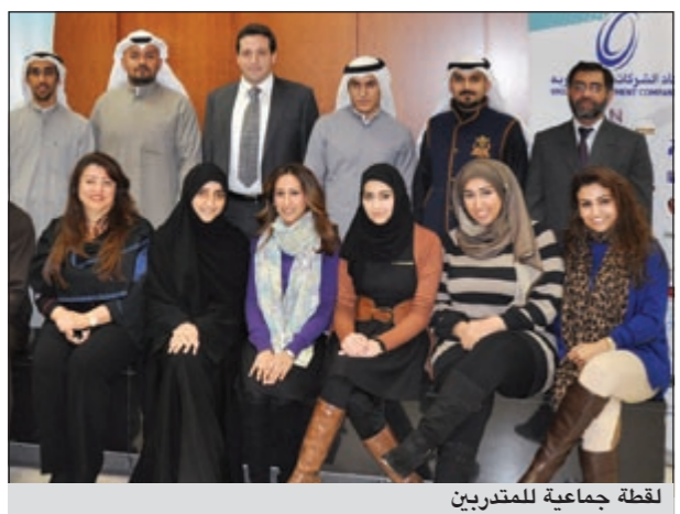
لقطة جماعية للمتدربين

المملكية الخاصة، تضمنت كيفية كتابة التقارير وكيفية تحليل العوامل الاقتصادية المؤثرة على تقييم الشركة ودراسة القطاعات وأساليب التقييم المختلفة. كذلك شملت الدورة تحليل القوائم المالية وتعديلها للحصول على التقييم الصحيح للشركات، وأضافت أن الهدف الأساسي للدورة هو زيادة وعي ومهارة المشاركين لتحليل القوائم المالية لإظهار التقييم الواقعي والصحيح للشركات.