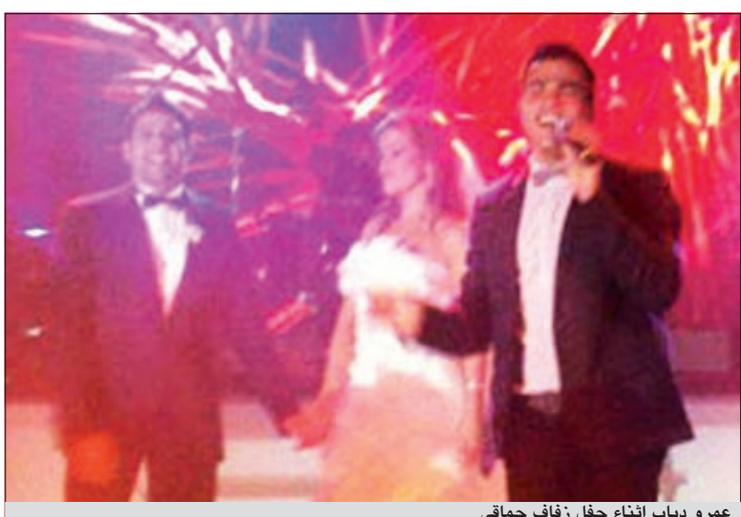
عمرو دياب اثناء حفل زفاف حماتي

على الرغم من الإجراءات الأمنية المشددة التي اتخذها محمد حماتي لمنع دخول الصحافيين والمصورين إلى حفل زفافه الذي أقيم الأربعاء الماضي في فندق «فورسيزون» في القاهرة، إلا أنه تم تسريب عدد من صور الفنان وعروسه نهلة خلال الزفاف. وعلى الفور، قام محبو المطرب المصري بتداول هذه الصور عبر «فيسبوك» رغم أن جودتها