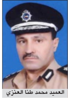
العميد محمد طنا العنزي

تقدم صباح امس مدير امن محافظة مبارك الكبير العميد محمد طنا العنزي بكتاب تقاعدي الى إدارة شؤون قوة الشرطة في منطقة الرقعي وذلك من أجل الترشح للدائرة الرابعة. وستتم الموافقة على الكتاب خلال هذه الأيام وسيقوم مساعد مدير أمن مبارك الكبير العميد محمد طنا العنزي بتسليم مركز مدير امن محافظة مبارك الكبير بالوكالة.