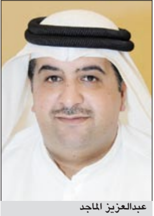
عبد العزيز الماجد

العملية الانتخابية قال الماجد في تصريحات لـ «الأنباء» أمس إن هناك لجنة استشارية معنية بهذا الأمر يقوم بتشكيلها المجلس الأعلى للقضاء وهي التي تحدد عدد القضاة للإشراف على العملية الانتخابية. وأكد الماجد أن فرز الأصوات سيكون يدويا وليس الكترونيا تلافيا لحدوث أي أخطاء أو مشاكل في عملية الفرز وتحققا لأكبر قدر من الشفافية والنزاهة.