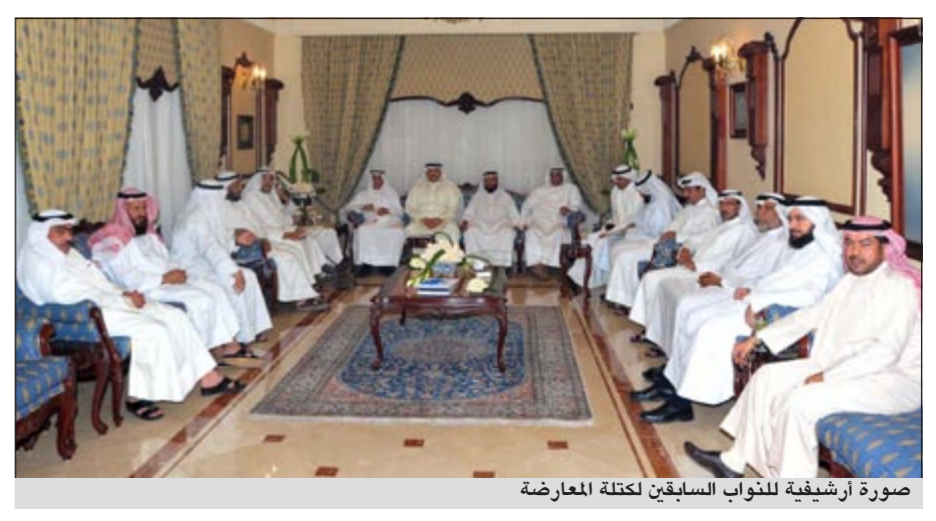
صورة أرشيفية للنواب السابقين لكتلة المعارضة

مع انتظار مرسوم الدعوة للانتخابات لدعوة الناخبين لاقتراع أصواتهم دخلت الحسبة الانتخابية أرقاما جديدة بعد انقسام مجلس الأمة 2009 إلى نواب قبضه كما يحلو للبعض تسميتهم ونواب معارضة قادوا الجماهير نحو الدفع بحل مجلس الأمة وتغيير رئيس الوزراء. الجملة التي تلقاها النواب المواليون للحكومة وتشبيهم بالقبضه جعلت من فرص نجاحهم وعدوتهم إلى كراسي البرلمان في حسابات معقدة دخلت حين خطوط العنكبوت، فالمعارضة ليس لديها ما تخسره فالشارع جسد ذلك من خلال ساحة الإرادة ولكن! «لكن» تلك تكمن في سؤال يتناقله المتابعون للوضع السياسي وحيثيات أطراف المجتمع الكويتي هل المعارضة قادرة على إسقاط «القبضه»؟ السؤال هنا إجابته تختلف من دائرة إلى أخرى فالرفعة الانتخابية في الدوائر الخمس تختلف باختلاف التوجه «الدائري» لأطراف مجتمعها. فالرهانة هنا على إسقاط نائب موال للحكومة ليست على رهان كاسب فلو باشرنا في الدائرة الأولى مثلاً فالعديد من النواب «الموالين» لهم تأثيرهم وقوا عدمهم التي حاكوها منذ ما يقارب العشرين عاماً جالوا وصلوا في دواوينها وسقوطهم في الانتخابات المقبلة سيكون ثقيلًا جدًا وصعباً حسابياً. كذلك هو الحال في الدائرتين الثانية والثالثة وان اختلفتا في نسجهما الليبرالي والإسلامي فيما عدا خطيان في الثالثة وهي ذات الطابع القبلي والصليبيات والدوحة في الثانية. ومع الالتفات للدائرتين الرابعة والخامسة وهما ذاتي الطابع القبلي البحت حيث يشلان