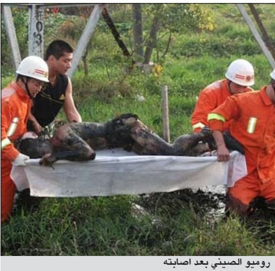
روميو الصيني بعد اصابته

تعرض شاب لضغط عال من الكهرباء عندما صعّد على عمود كهرباء، ما أدى إلى حروق شديدة في جسده في تشيوانتشو جنوب الصين. بحسب ما ورد في الصحيفة البريطانية «دايلي مايل». وأشارت الصحيفة أن الشاب قد انفصل عن حبيبته، وبعد يومين من التفكير قرر صعود عمود ضغط عال قريب من مكان عملها لكي يبرهن لها عن حبه ويتقدم بطلب الزواج منها.