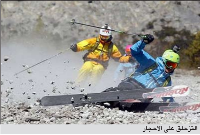
التزلح على الأحجار

يتزحلقون بالاسكي على الأحجار الصغيرة المتوافرة بكثرة على المنحدرات. ويتدرّب المتزحلقون في بلدة هايمغ غرب البلاد، ويؤكد الرياضيون أن مزاوله هذه الرياضة الخطرة تصحهم انطباعات وانفعالات لا تحصى، إلا أنهم شدوا على خطورة هذا النوع من الرياضة. ومع ذلك يامل هؤلاء المتزحلقون في أن تجلب هوايتهم الجديدة في القريب العاجل عددا لا بأس به من المشاركين والمعجبين، وأنه سيكون من الممكن في المستقبل إقامة مسابقات دولية في هذا المجال.