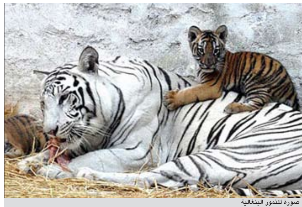
صورة للنمر البنغالي

نيودلهي - وكالات: في حفل أقيم في إحدى حدائق حيوان غاندي بالهند مؤخراً كان أول ظهور لأنثى النمر البنغالية البيضاء «يامونا» أمام الكاميرات بعد ولادتها شبليين صغيرين من النمر البنغالي اللون أبيض عليها اسم «لوف وكوش»، وفقاً لصحيفة الدايلي ميل البريطانية.