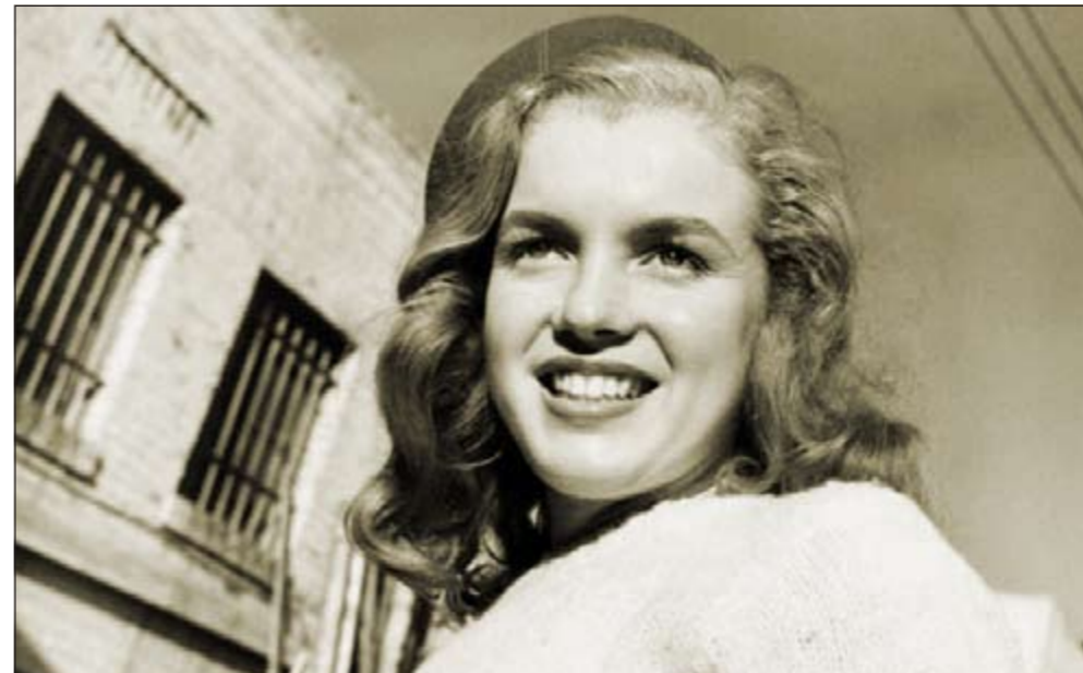
أحدى صور مارلين مونرو

لوس أنجليس - أ.ف.ب: بيعت عشرات الصور لمارلين مونرو في شبابه عندما كانت لا تزال تعرف بنورما جين بيكر بسعر 352 ألف دولار في مزاد علني في لوس أنجليس عرضت للبيع خلاله أيضاً مئات التذكارات عن النجوم.