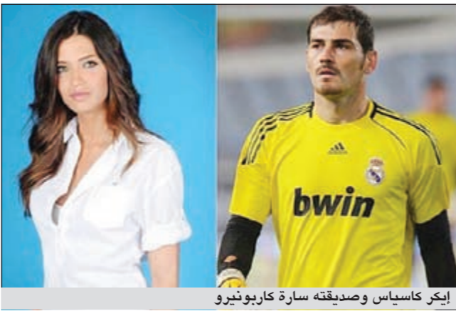
إيكر كاسياس وصديقتها سارة كاربونيرو