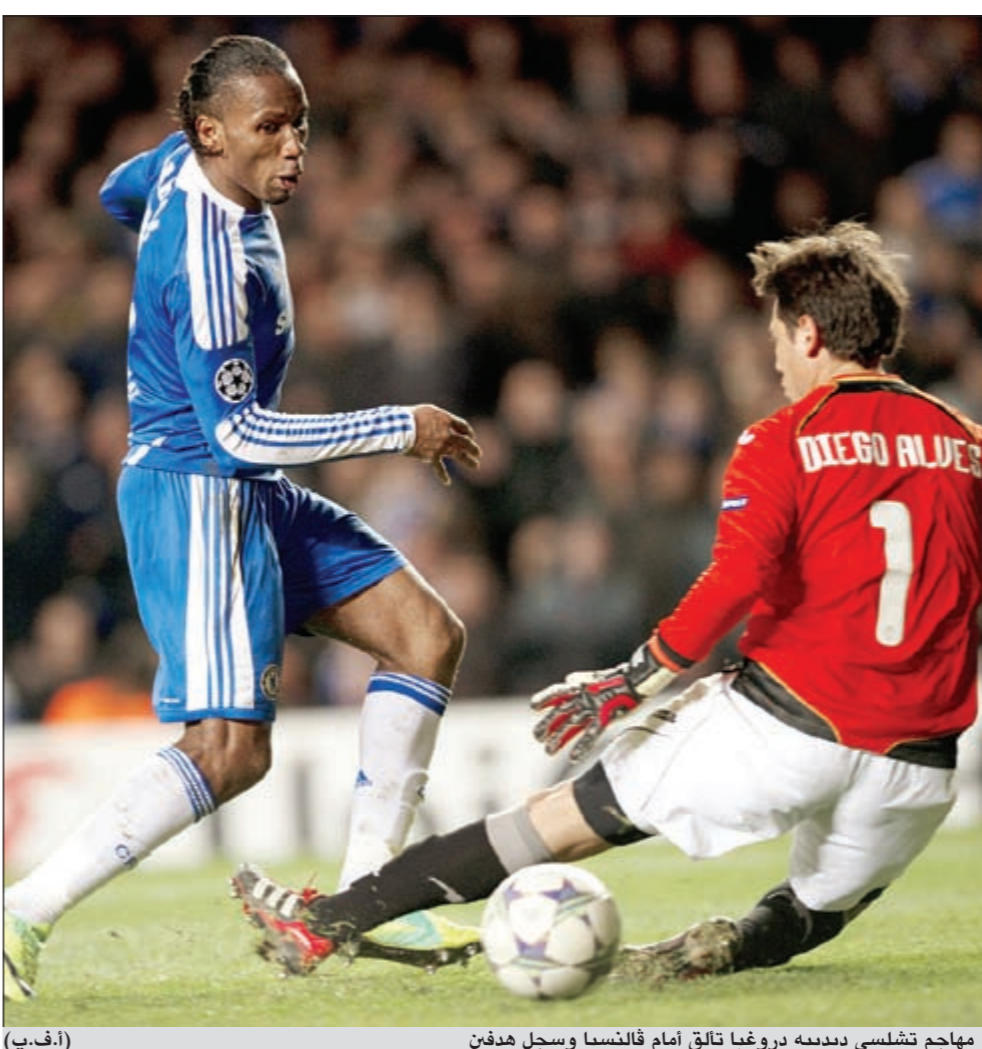
مهاجم تشلسي ديبديه دروغبا تالق أمام فالنسيا وسجل هدفين (أ.ف.ب)

وسيكمل اولمبيكوس المشوار في الدوري الأوروبي. وفي المجموعة الثانية، فاز برشلونة الإسباني الذي لعب بالفريق الريدف مندرخا جهود لاعبيه الإسبايين الكلاسيكو المرتقب ضد ريال مدريد السبت المقبل على باتي بوريوسف الـ 4 وسجل سيرجي روبرتو (35) ومونتويا (60) وبدرو رودريغيز (63) و87 هدفين، وسجل البرازيلي الكسندر باتو (47) ومواطنه روبينيو (50) هدفي ميلان، وديفيد بايستون (89) ودوريس (90) هدفي فيكتوريا.