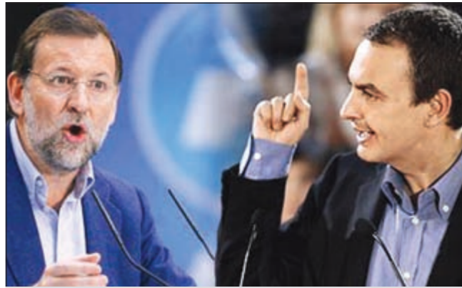
رئيس الوزراء الإسباني ثاباتيرو وخليفته راخوي