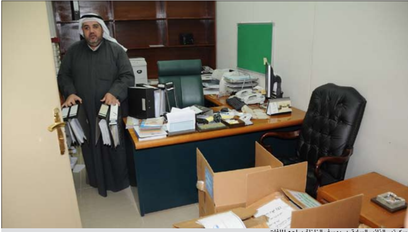
سكرتير النائب السابق د. يوسف الزلزلة يراجع الملفات