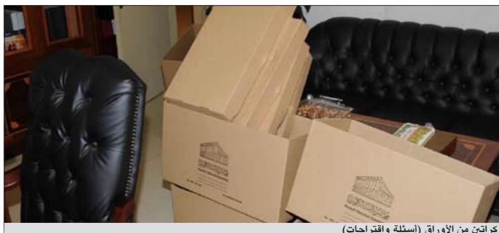
كراتين من الأوراق (أسئلة واقتراحات)