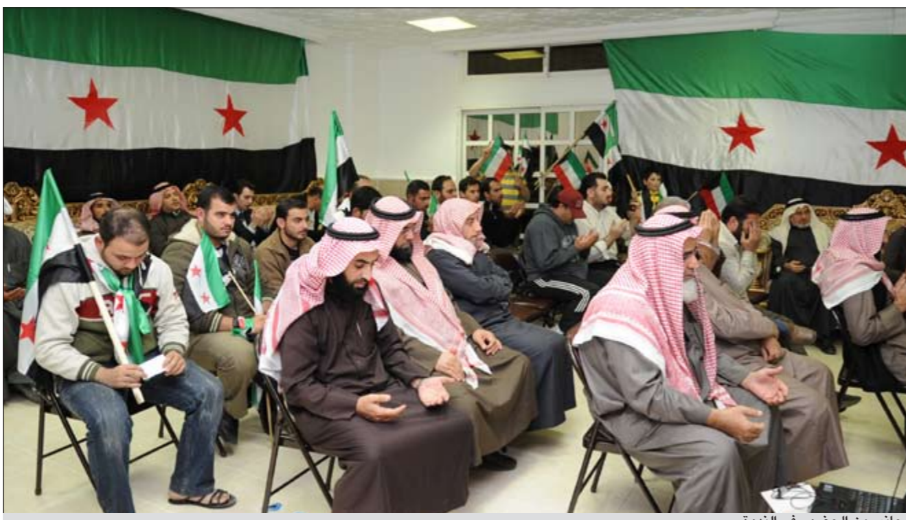
جانبا من الحضور في الندوة