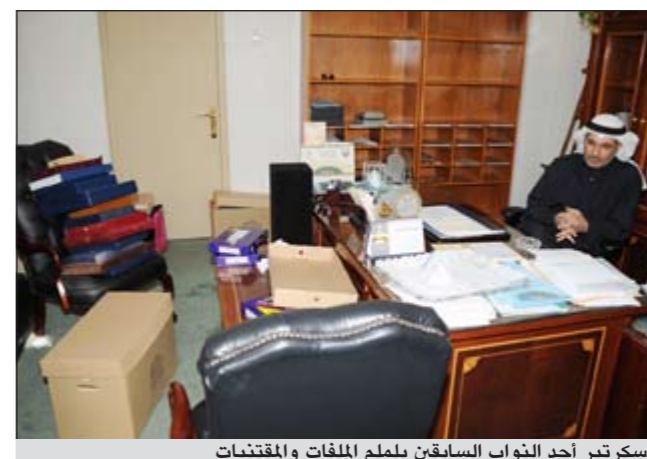
سكرتير أحد النواب السابقين يلمم الملفات والمقتنيات

قال الأمين العام لمجلس الأمة علام الكندري إن الأمانة العامة أصدرت قراراً يخص سكرتارية الاعضاء الذين مازال نديهم مستمرا باعطائهم مهلة من اليوم حتى 15 الجاري للالتحاق بوظيفتهم الاصلية وانهاء نديهم.