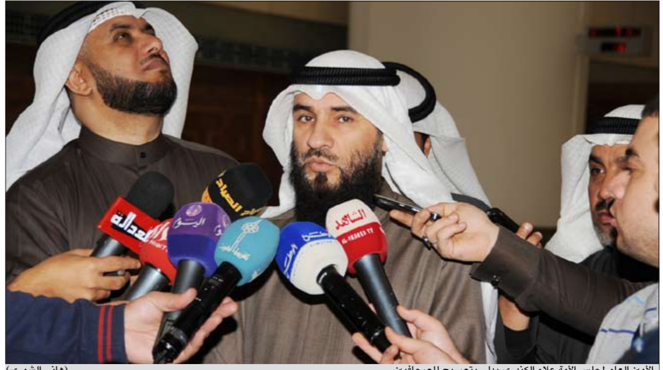
الأمين العام لمجلس الأمة علام الكندري يدلي بتصريح للصحافيين