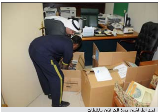
أحد الفراشين يملأ الكراتين بالملفات