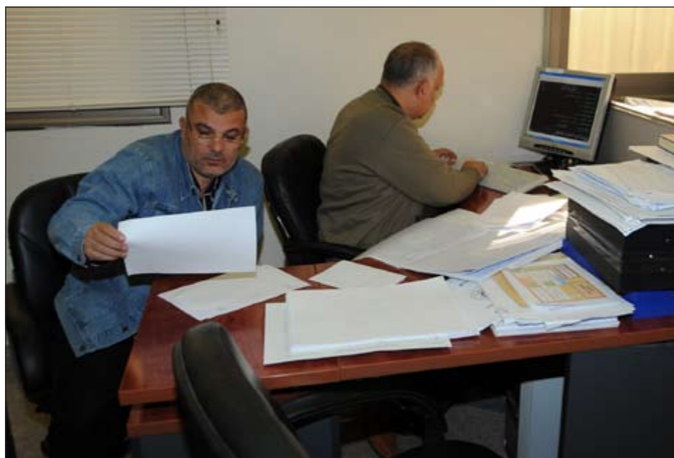
العمل على قدم وساق داخل ادارة شؤون الانتخابات