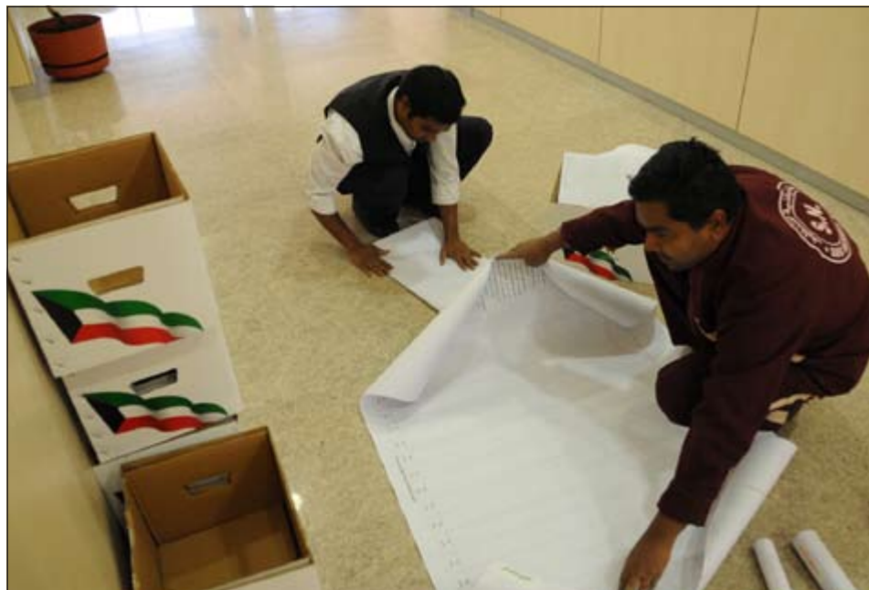
إعداد الجوسترات اللازمة