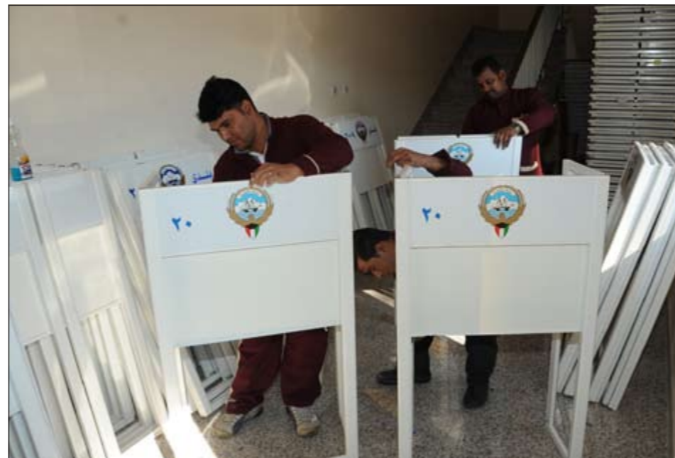
إصلاح وتجهيز اللوحات الإرشادية