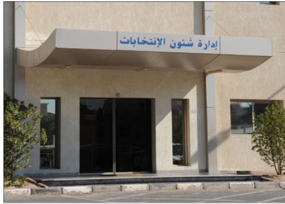
إدارة شؤون الانتخابات بدأت استعداداتها للعملية الانتخابية

ايضا بحصر كشوفات الناخبين من الذين يحق لهم التصويت والذين لا يحق لهم وكذلك اعداد كشوفات بأسماء الناخبين المتوفين لاستبعادهم من الكشوفات التي يحق لهم الانتخاب من خلالها. ● فرج ناصر