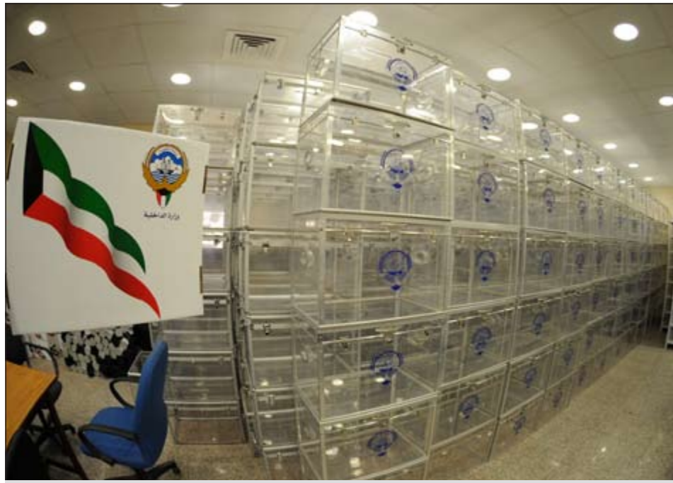
الصناديق الزجاجية جاهزة ليوم الاقتراع (هاني الشمري)

ايضا بحصر كشوفات الناخبين من الذين يحق لهم التصويت والذين لا يحق لهم وكذلك اعداد كشوفات بأسماء الناخبين المتوفين لاستبعادهم من الكشوفات التي يحق لهم الانتخاب من خلالها. ● فرج ناصر