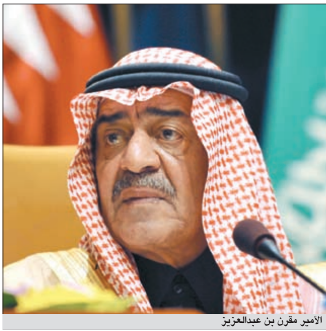
الأمير مقرن بن عبدالعزيز

وقال الامير بندر أمس الأول ان القوانين الخاصة بوسائل الاعلام شهدت تطوراً على مدى الاربعة عاما الماضية وانه خلال السنوات العشر التي شارك فيها في هذا المجال شاهدها تتطور على نحو هائل. ويعتقد المحللون ان جريدة الوطن تميل نحو الاتجاه التقدمي في الطيف الاعلامي بالمملكة حيث تنتشر اقتراحات تدعم بقوة الإصلاحات الاقتصادية والاجتماعية التي ادخلها الملك عبدالله وتحتدي منتقدتنا لا تتحاج إلى حرب أخرى. وقال لا تخدم أحدا بل تخر البول والتبور على دولها كافة دون استثناء، فمن واجب كل دولة أن تعي ذلك وأن تسعى لأن تكون عامل استقرار في منطقة الخليج العربي، وليس عامل زعزعة وتهديد وتازم، وعلى الأسرة الدولية، أن تبذل جهدها في هذا