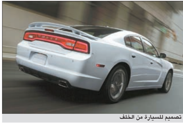
تصميم للسيارة من الخلف