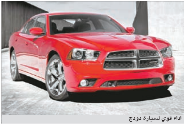
أداء قوي لسيارة دودج

وبالنسبة لعام 2012، تعتبر تشكيلة تشارجر جزءاً من مجموعة منتجات دودج الأوسع التي تركز على الأداء والقيمة، وتشتمل موديلات دودج تشارجر SE وSXT على محرك Pentastar V6 خفيف الوزن سعة 3,6 ليترات الذي تبلغ قوته 292 حصاناً لقيادة تحقق 31 ميلاً للغالون على الطريق السريع (مع ناقل حركة من ثماني سرعات)، وبمجهز السيارة بمحرك هيمي الأسطوري V8 HEMI@ سعة 5,7 ليترات، تحقق تشارجر 2012 موديل R/T قوة حصانية تبلغ 370 حصاناً وتحقق 25 ميلاً للغالون على الطريق السريع مع التكنولوجيا المتكيفة لتوفير الوقود من خلال وضعية الأسطوانة الأربعة، كما تقدم موديلات دودج تشارجر أيضاً مزايماً متعددة على صعيد التكنولوجيا والأداء والقيمة لمساعدة العملاء على تجهيز سياراتهم الرياضية بما يلي احتياجاتهم.