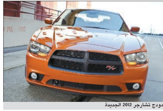
دودج تشارجر 2012 الجديدة

بناء على الزخم الذي شهد طرح ست سيارات جديدة بالكامل أو معاد تصميمها بالكامل لعام 2011، تنطلق علامة دودج التجارية قداماً إلى الأمام بمجال تكنولوجيا نقل الحركة لعام 2012، وعلى أساس النجاح الذي حققته تشارجر الجديدة كلياً التي تم طرحها في 2011، تأتي دودج تشارجر 2012 لتكون أول سيارة سيدان رياضية أميركية يتم تجهيزها بنظام أوتوماتيكي لنقل الحركة من ثماني سرعات، ليحقق الأفضل ضمن فئتها ويبلغ 31 ميلاً للغالون على الطريق السريع.