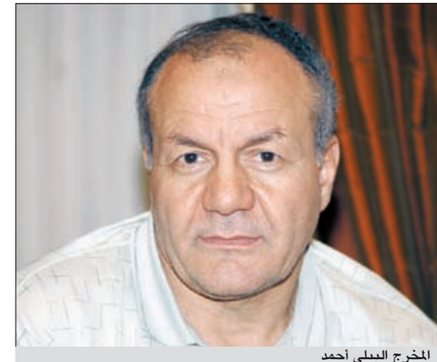
المخرج البيلي أحمد

وأردف: العمل به عدة خطوط درامية متشابكة وشائكة وتوقع أن ينال النجاح، لاسيما أنه يمس شريحة النساء المتزوجات والبنات وهن يشككن نسبة كبيرة من متابعي الأعمال الدرامية، موجهها شكره لفريق العمل «المتجانس»، بحسب قوله، والذي أنجز تصوير أكثر من نصف المسلسل ولم يتبق إلا أسبوعان على انتهاء التصوير ليكون العمل جاهزاً للعرض بداية عام 2012، مؤكداً أن الممثلين أدوا أدوارهم عن دون تكلف أو مبالغة وكانوا طبيعيين لأبعد الحدود، وهذا ما يشعر به كل من يتابع «عشرة عمر».