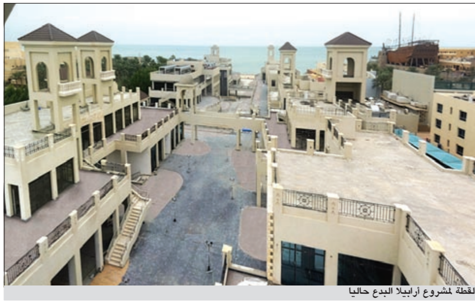
لقطة لمشروع أرابيلا البدع حالياً