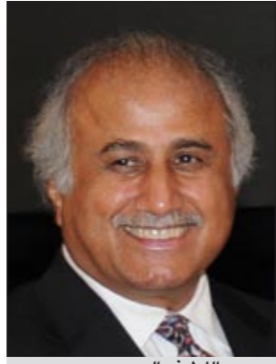
د. عبداللطيف البدر

أصدر مدير جامعة الكويت د.عبدالله اللطيف البدر عدداً من القرارات التي تقضي بتجديد تعيين عدد من رؤساء الأقسام العلمية في كل من كلية الطب وكلية الصيدلة وكلية العلوم الإدارية، وذلك وفقاً لما يلي: