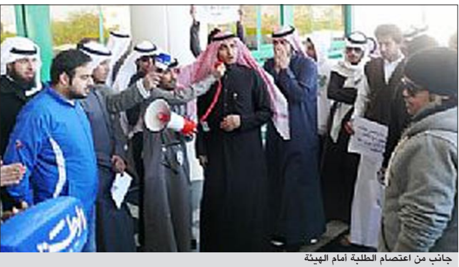
جانب من اعتصام الطلبة أمام الهيئة

مصلحة الطالب خط احمر وأن الاتحاد لن يقف موقف المتفرج تجاه تلك التجاوزات وضرورة ايجاد مخرج لما يعانيه الطالب من قبل مكتب التسجيل.