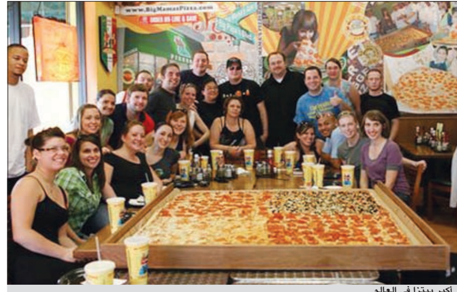
أكبر بيتزا في العالم

لتناولها في منزله ان يتوافر باب كبير حتى تدخل منه بدلا من قلبها.