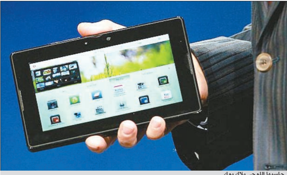
حاسبها اللوحي بلاك بوك

تورونتو-أ.ش.: أعلنت شركة «ريسريش إن موشن» الكندية، رائدة صناعة الحاسبات والهواتف المحمولة في العالم، عن بدء التحقيق في مزاعم كسر حماية حاسبها اللوحي الجديد «بلاي بوك» من قبل بعض القرصنة على الإنترنت.