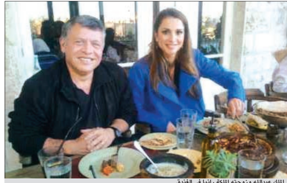
الملك عبدالله وزوجته الملكة رانيا في الفندق

بجهود الشباب الاردنيين في تقديم كل ما من شأنه تنشيط الحركة السياحية في الأردن.