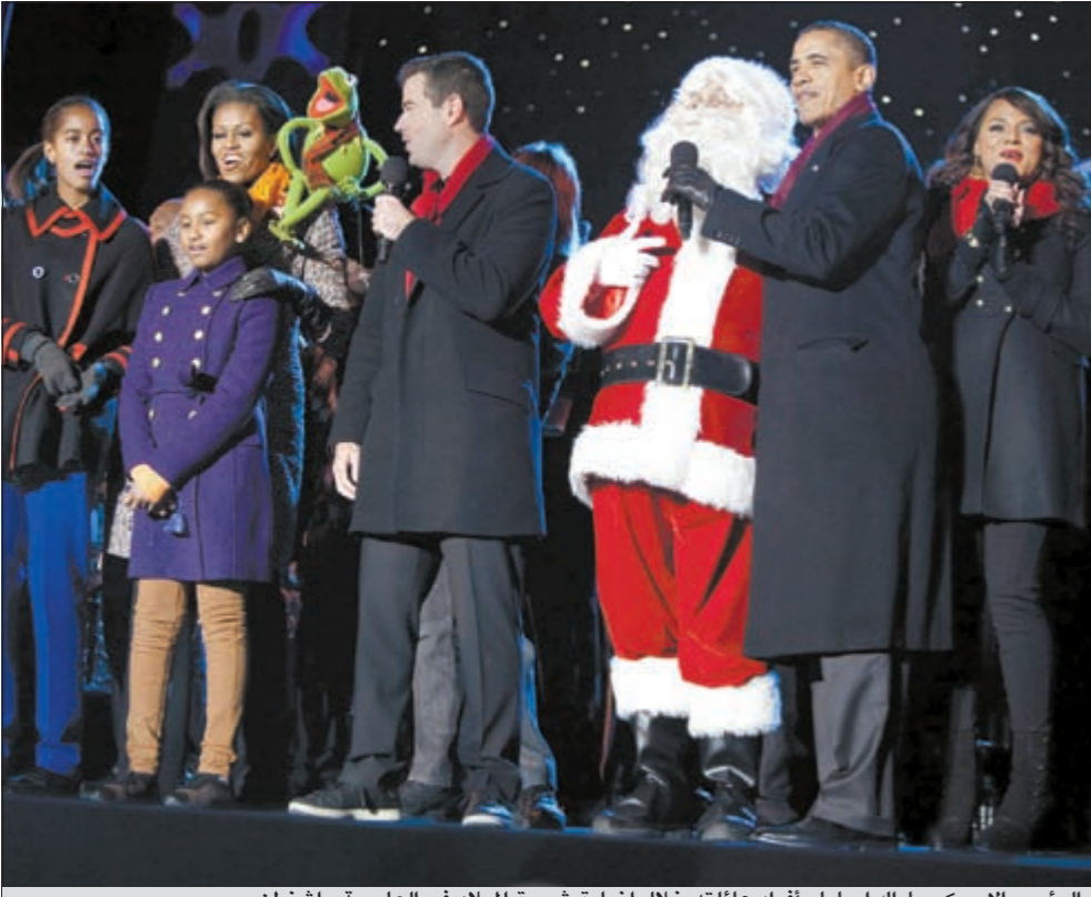
الرئيس الأميركي باراك أوباما وأفراد عائلته خلال إضاءة شجرة الميلاد في العاصمة واشنطن

السرو السابقة التي غرست العام 1978. وأكد الرئيس «نعرف ان هذا التقليد أهم من أي شجرة». وقال الرئيس الأميركي «في موسم الأعياد هذا نشدد مجدداً على الروابط التي توحدنا كأفراد عائلة واحدة وكجيران وكأميركيين مهما كان لون بشرتنا ومعتقداتنا أو إيماننا، فلنتذكر اننا عائلة واحدة».