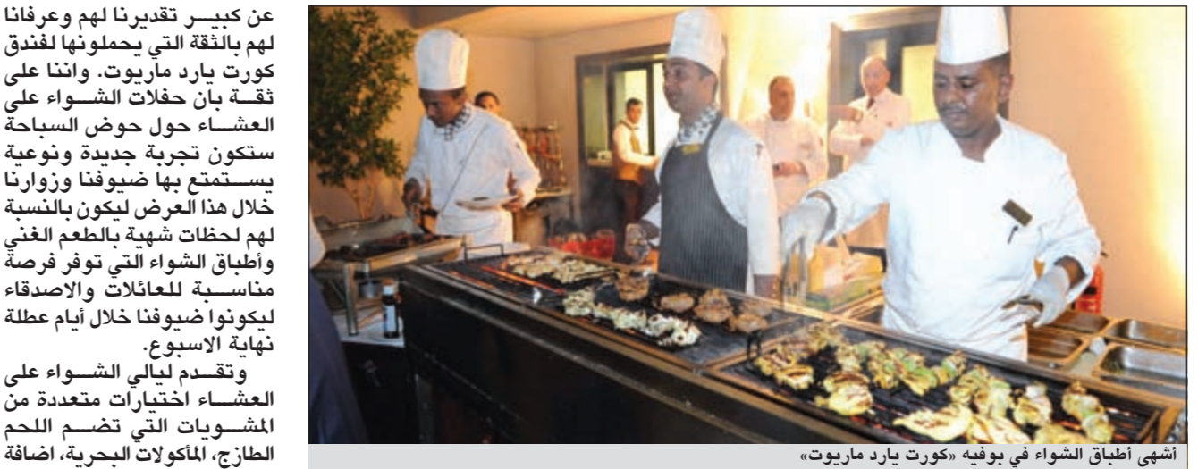
أشهى أطباق الشواء في بوفيه «كورت يارد ماريوت»

عن كبير تقديرنا لهم وعرفانا لهم بالثقة التي يحملونها لفندق كورت يارد ماريوت. واننا على ثقة بان حفلات الشواء على العشاء أقيم حول حوض السباحة في الطابق العاشر. وتم الترحيب بالضيوف ودعوتهم الى تجربة عشاء جديدة وشهية مع أطباق الشواء التي تم إعدادها خصيصا لهم. كما شهدت الأمسية فقرات ممتعة ومميزة شملت الموسيقى الحية التي قدمتها فرقة من فندق كورت يارد ماريوت. كما استمتع الضيوف بالإطلالة الساحرة والمجملة من الطابق العاشر على مدينة الكويت في الليل، بينما كانوا يتذوقون أشهى المأكولات والأطباق الغنية بالطعم والتميز ليحظى الجميع بلحظات جميلة وأمسية مميزة.