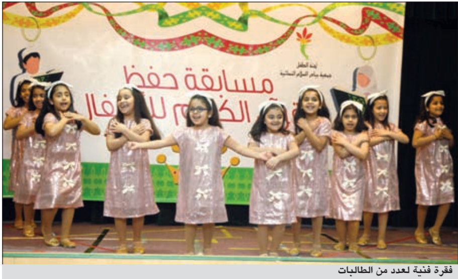
فكرة فنية لعدد من الطالبات

نظمت لجنة الطفل التابعة لجمعية بيادر السلام النسائية حفلا لتكريم الأطفال الفائزين في مسابقة «تاج من نور» الأولى لحفظ القرآن الكريم وذلك على مسرح حضنة السلام التابعة للجمعية بمنطقة الروضة، بمشاركة 48 متسابقا ومتسابقة من مختلف المراحل الدراسية. وقد حصل على المراكز الأولى 19 فائزا وفائزة تم تكريمهم في حفل حضرته رئيسة