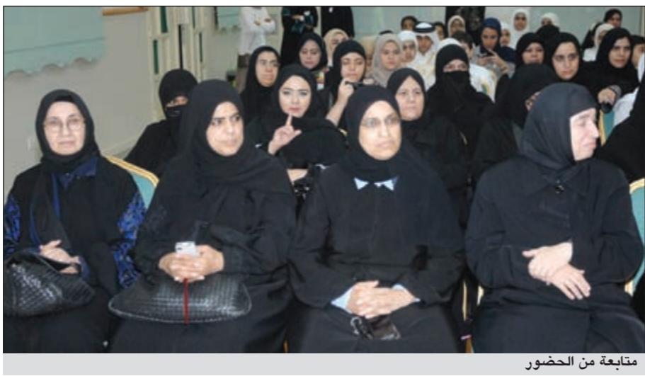
متابعة من الحضور