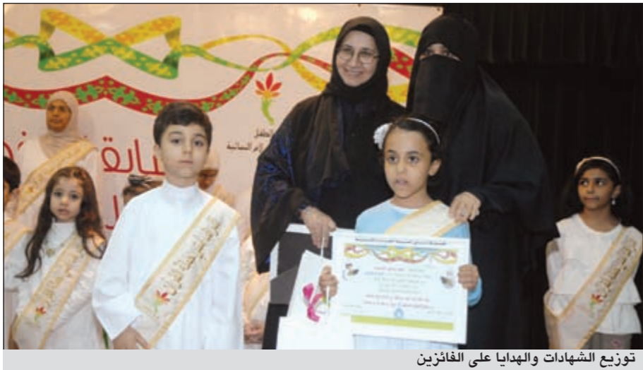
توزيع الشهادات والهدايا على الفائزين