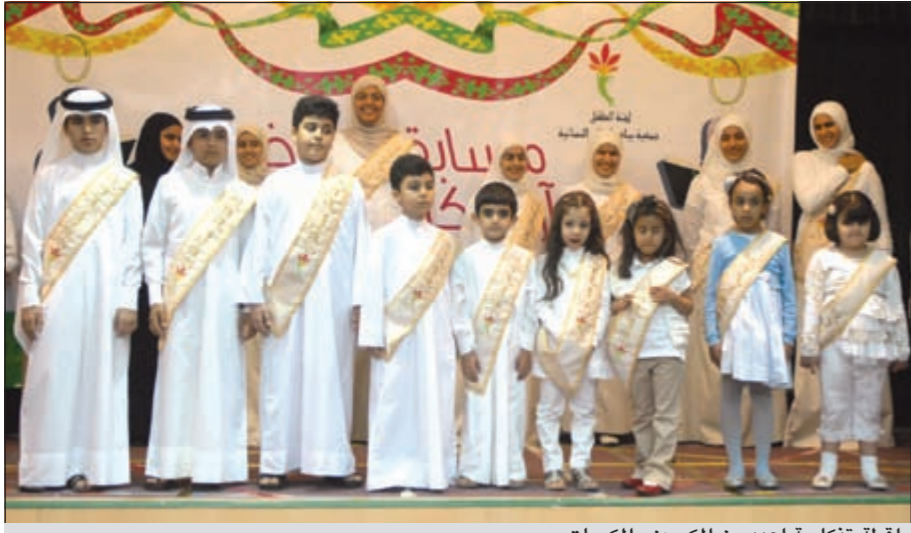
لقطة تذكارية لعدد من المكرمين والمكرمات