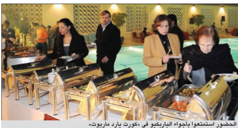
الحضور استمتعوا بأجواء الباربيكيو في «كورت يارد ماريوت»

عن كبير تقديرنا لهم وعرفانا لهم بالثقة التي يحملونها لفندق كورت يارد ماريوت. واننا على ثقة بان حفلات الشواء على العشاء أقيم حول حوض السباحة في الطابق العاشر. وتم الترحيب بالضيوف ودعوتهم الى تجربة عشاء جديدة وشهية مع أطباق الشواء التي تم إعدادها خصيصا لهم. كما شهدت الأمسية فقرات ممتعة ومميزة شملت الموسيقى الحية التي قدمتها فرقة من فندق كورت يارد ماريوت. كما استمتع الضيوف بالإطلالة الساحرة والمجملة من الطابق العاشر على مدينة الكويت في الليل، بينما كانوا يتذوقون أشهى المأكولات والأطباق الغنية بالطعم والتميز ليحظى الجميع بلحظات جميلة وأمسية مميزة.