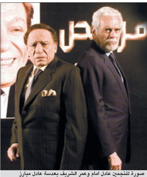
صورة للنجيين عادل امام وعمر الشريف

بعد هذه الخبرة الطويلة ألا تفكر في إعطاء دورات بالتصوير للهواة؟ ● أنا بالفعل أعطي دورات في مكنتي لرأغبى ومحبي التصوير، في أي فرع من فروع الفوتوغرافيا سواء استوديو أو بورتريه أو غيره، وليست لدي عقدة «أسرار المهنة» فأنا أعلم علمي وخبراتي للطلبة.