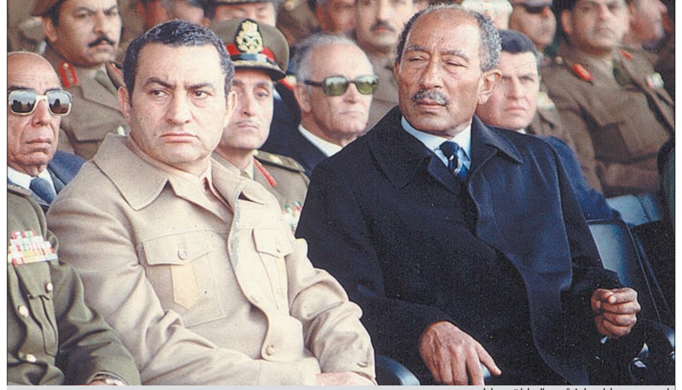
أحدى صور عادل مبارز تجمع السادات ومبارك