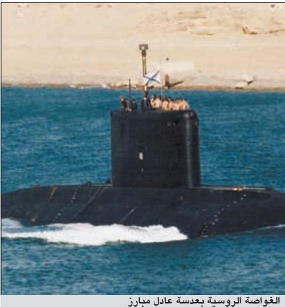
الغواصة الروسية بعدسة عادل مبارز