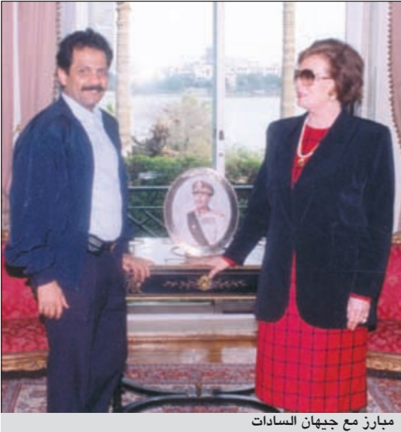
مبارز مع جيهان السادات