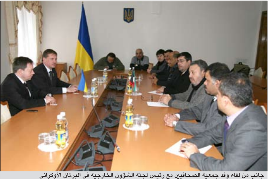
جانب من لقاء وفد جمعية الصحفيين مع رئيس لجنة الشؤون الخارجية في البرلمان الأوكراني