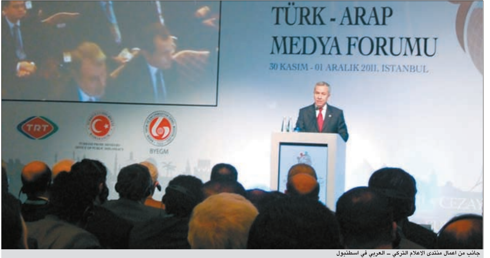
جانب من أعمال منتدى الإعلام التركي - العربي في اسطنبول

ويذكر ان كافة الدول الأوروبية تعتمد حالياً نظام الليسانس والمحستير والدكتوراه وفقاً لمخطط بولونيا لعام 1998 الذي يضم 47 دولة اوروبية واوراسيوية.