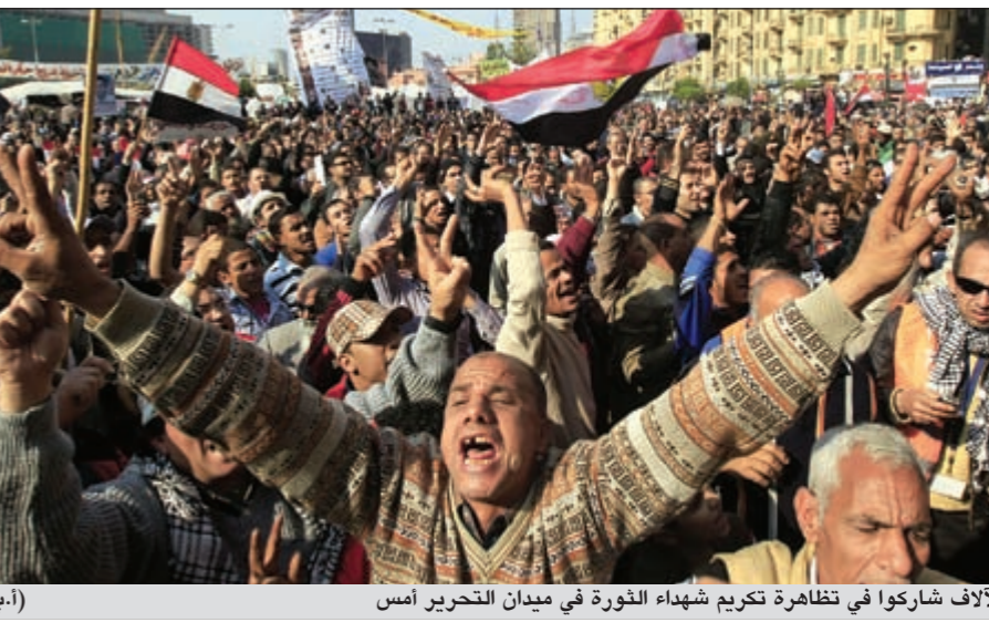
الآلاف شاركوا في تظاهرة تكريم شهداء الثورة في ميدان التحرير أمس (إب)

تظاهرة في «التحرير» لتكريم «شهداء الثورة» وأخرى في «العباسية» لتأييد «العسكري» مصر: نسبة التصويت في المرحلة الأولى للانتخابات البرلمانية الأعلى منذ «الفراعة»