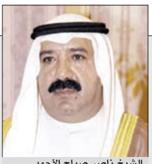
الشيخ ناصر صباح الأحمد

مبارز لـ «الانباء»: كنت مصوراً صحافياً في رئاسة الجمهورية أيام السادات 13