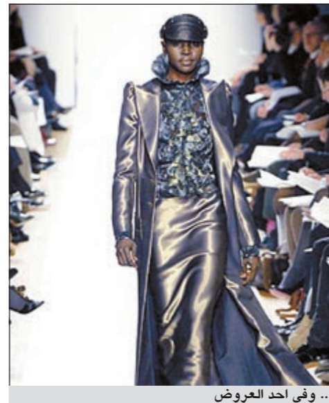
.. وفي احد العروض