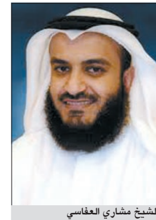
الشيخ مشاري الغفاسي