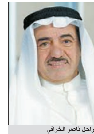
الراحل ناصر الخرافي