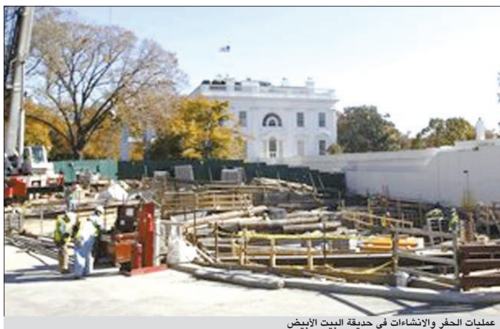
عمليات الحفر والانشاءات في حديقة البيت الأبيض

يسمح بحمايته والرئيس معاً. بل ان هناك رواية تقول أن بوش نقل أيضاً من المقر الرئاسي إلى موقع آخر قد يكون البداية التنفيذية وهي بناية كبيرة تقع بالقرب من البيت الأبيض. ويعني ذلك أن مدى تحصين الخندق الذي يوجد بالفعل تحت المقر الرئاسي الأميركي لا يتيح حماية كافية. وقالت إدارة الخدمات العامة التي تشرف على أعمال الصيانة في البيت الأبيض ان تلك الأعمال بدأت منذ مايو 2009. بيد ان الصحافي في «واشنطن بوست»، كريستيان دافنورت قال ان عاملين في البيت الأبيض أبلغوه بأن الحفر على صلة «بأعمال أمنية» وأنه لا علاقة له بصيانة التوصيلات الكهربائية.