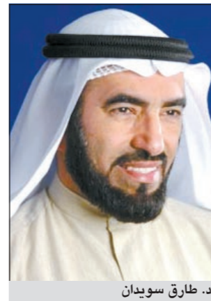
د. طارق سويدان