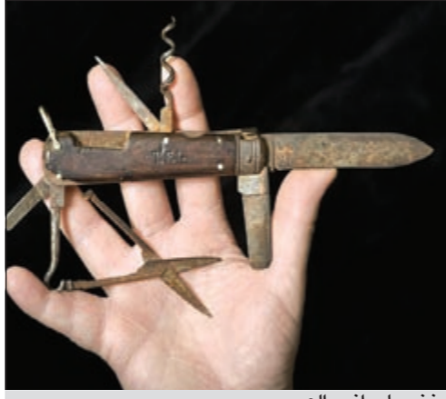
خنجر لورانس العرب

لندن - يوبي.آي: خنجر الضابط البريطاني توماس إدوارد لورانس الذي عرف خلال الحرب العالمية الأولى بـ «لورانس العرب» للبيع في مزاد علني هذا الشهر في بريطانيا.