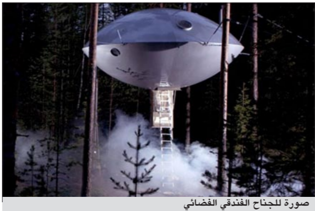
صورة للجناح الفندقي الفضائي

مما جعل السلسلة تفوز بجائزة السياحة الكبرى هناك. يتقسم الجناح لطابقين وتبلغ نفقة قضاء فريدين ليلة واحدة فيه حوالي 420 جنيه استرليني (ما يعادل 2452 ريالا سعوديا) شاملة وجبة الإفطار فقط.