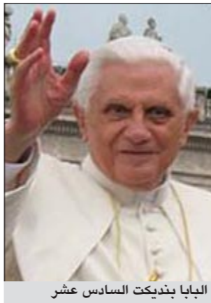
البابا بندكت السادس عشر

فرايبورغ جنوبي ألمانيا وذلك خلال زيارة رسمية في سبتمبر. وقالت مكاتب ساندرمان القانونية التي تمثل مقدم الشكوى إن بإمكانها تقديم شهودا رأوا البابا وهو لا يرتدي حزام الأمان في السيارة المخصصة لنقله. كما تضمنت الشكوى أسماء عدد من المسؤولين مثل كبير أساقفة فرايبورغ ورئيس اتحاد الأساقفة الكاثوليك الألمان ما يعد مخالفة لقوانين السلامة. لكن محكمة باسم مدينة فرايبورغ قالت الأربعاء إن البابا