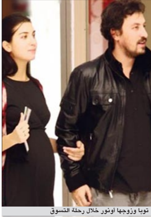
توبا وزوجها أونور خلال رحلة التسوق

ام بي سي: اصطحبت النجمة لتركيا توبا بيوكستون الشهيرة بـ«لميس»، في «بائعة الورد»، زوجها الفنان أونور صايلاك، والذي جسد دور «رافت» في المسلسل نفسه وتوجهها إلى مركز تسوق «أك مركزي» في منطقة اتلار في إسطنبول لشراء ملابس مولوديهما التوأمين. وكانت قد بدأت علاقة النجمين منذ مطلع عام 2011، حيث شاركتها بطولة مسلسل «بائعة الورد» وقد لوحظ اختفاء العاشقين فور انتهاء المسلسل في تركيا. وقد بدأت «لميس»، الحامل في شهرها السابع، وزوجها «رافت» في تجهيز مستلزمات توأميها، حيث بدأ إحساس الأمومة بكل حياتها حسب تقرير صحيفة حريات التركية. والجدير بالذكر بأن النجمة التركية دخلت القفص الذهبي في العاصمة الفرنسية باريس في شهر يوليو الماضي، حيث تزوجت من الممثل «أونور صايلاك»، الذي جسد دور زياد في مسلسل «عاصي» ودور «رافت» في «بائعة الورد». وتم عقد قران النجمين في القنصلية التركية بحضور عائلتهما وأصدقائهما المقربين جداً، بعدما علمت بأنها حامل في توأم.