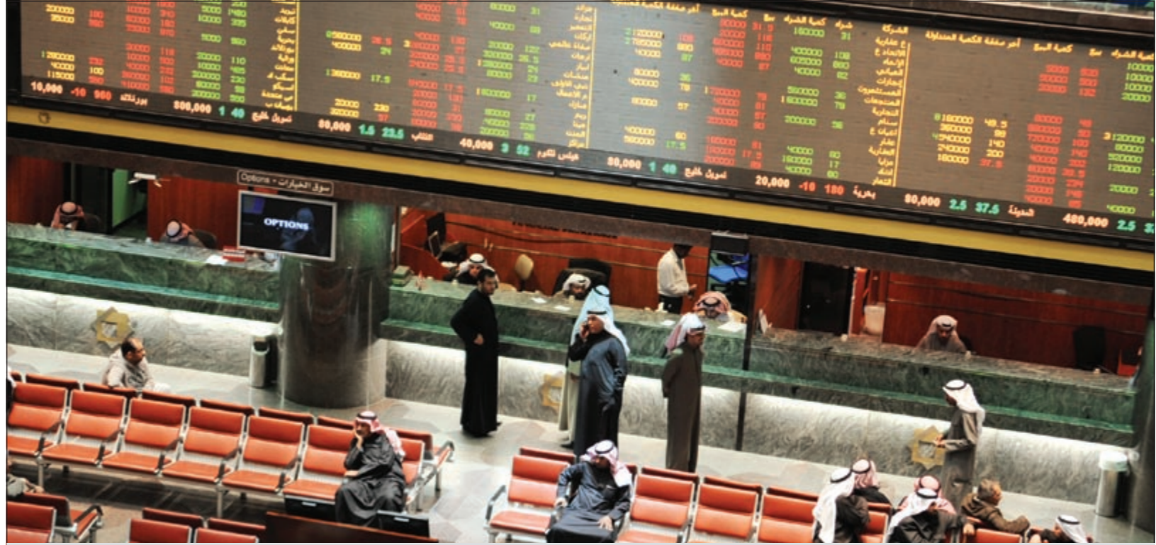
تفاوض باستمرار اللون الأخضر

ضوء ذلك، وكان سهم الاهلية الأكثر تداولاً من خلال أكثر من 25 مليون سهم، ولكن غلب على هذه التداولات البيع مما أدى إلى تراجع السهم بواقع 0,5 فلس، وشهد سهم الساحل نشاطاً ملحوظاً من خلال تداول 5,3 ملايين سهم، كذلك ارتفع المال بواقع فلس واحد بعد تداول كمية مماثلة، وشهدت أسهم المدينة وصكوك والسلام نشاطاً كبيراً أدى إلى ارتفاع هذه الأسهم، كما نشط سهم الديرة التابع لمجموعة ايغا وتم تداول أكثر من 7 ملايين سهم وارتفع بمقدار فلس، وواصل سهم الامتياز نشاطه وارتفع بواقع فلسين بعد تداول أكثر من 1,5 مليون سهم. وقد استمر قطاع الشركات العقارية في مواصلة أدائه الجيد، واستحوذ على 17,1٪ من القيمة، وشهد سهم المياني تداولات قوية اقتربت من 3 ملايين سهم، وارتفع على أثر ذلك بواقع 10 فلوس ليصل إلى 890 فلساً، وشهد سهم ابيار تداول 8,5 ملايين سهم ولكن هذا النشاط غلب عليه البيع، كما تراجع قطاع الشركات الصناعية بشكل لافت في جلسة أمس، وكان ذلك بسبب تراجع سهم الصناعات بواقع 5 فلوس بعد تداول 2,5 مليون سهم، وشهد سهم اسيكو تراجعاً بواقع 8 فلوس بعد تداول 1,3 مليون سهم، فيما ارتفع سهم انابيب بواقع فلسين بعد تداول 840 ألف سهم.