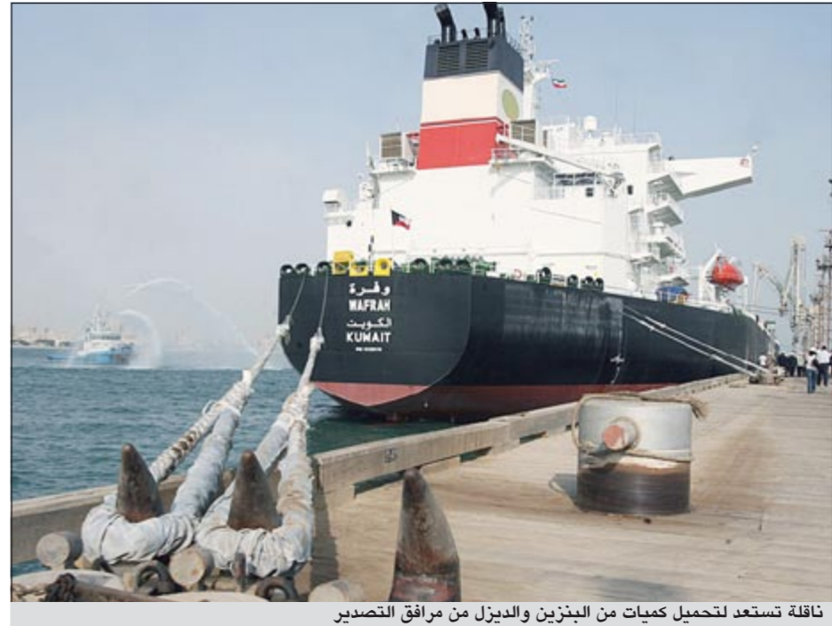
ناقلة تستعد لتحميل كميات من البنزين والديزل من مرافق التصدير

العام الماضي، مشيرة إلى أن بنغلادش تخطط لزيادة كميات الديزل المستوردة خلال الأعوام المقبلة بنسبة 34٪ لتصل إلى 1,6 مليون طن. تجدر الإشارة إلى أن قطاع التسويق العالمي في مؤسسة البترول الكويتية بعد الواجهة الدولية لصناعة النفط الكويتي، وذلك لأن أنشطته تتداخل محلياً وخارجياً، فهو صاحب الرأي في سياسات الإنتاج والتكرير محلياً، وعلى الصعيد الدولي يقوم ببيع منتجات المصافي والنفط الخام، كما أنه يستورد احتياجات السوق المحلي للكويت من غاز مسال ومنتجات أخرى مثل البنزين والميثانول.