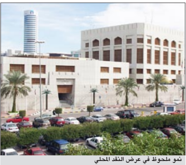
تم ملحوظ في عرض النقد المحلي

وأضافت أن صافي الموجودات الأجنبية للبنوك المحلية ارتفع في شهر أكتوبر الماضي بنسبة 2,2٪ ليبلغ 2326,4 مليون دينار.