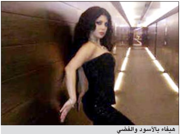
هيفاء بالأسود والفضي

بعدما توجهت الفنانة هيفاء وهي إلى دبي للمشاركة في سهرة نادي «كافالي» وأعربت في أكثر من تغريدة سابقاً عن حماسها لهذه السهرة، نشرت هيفاء عبر حسابها الخاص بموقع التواصل الاجتماعي «تويتر» صورة تبرز أناقتها وهي ترتدي ثياباً باللون الأسود وحذاء فضي اللون، وعلقت بأنها امضت وقتاً رائعاً مع الحضور.