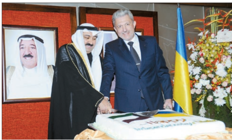
السفير الأميركي لدى الكويت ماثيو تولر والسفير الكويتي وليد الخبيزي يقطعان كعكة الاحتفال بالعيد الوطني الأوكراني.

بيّن السفير الأميركي لدى البلاد ماثيو تولر أن الولايات المتحدة الأميركية تعلم بان السلطات الإيرانية كانت تقف خلف الاعتداء الذي حصل على السفارة البريطانية في طهران، واصفا الامر «بالحدث الكبير»، مشيرا الى فشل الإيرانيين في حماية الممتلكات الدبلوماسية في عاصمتهم وقال «نحن نؤمن بأنه يجب على جميع دول العالم اتخاذ إجراءات شديدة تجاه ما حدث»، مبيّنا انه لهذا السبب جرت تصرييح وزارة الخارجية الأميركية بهذا الخصوص.