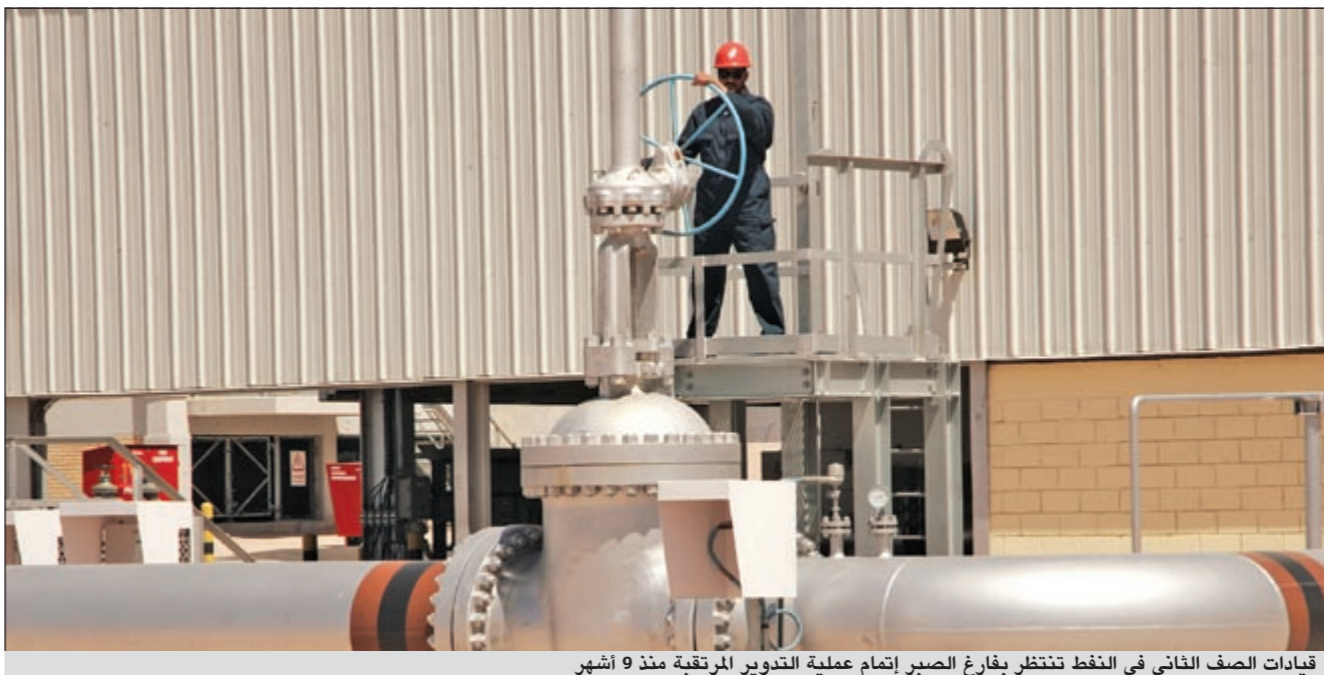
قيادات الصف الثاني في النفط تنتظر بفارغ الصبر إتمام عملية التدوير المرتقبة منذ 9 أشهر

لكتاب رسمي يعترض فيه على المعايير التي تطبقها المؤسسة في عمليات التدوير. وتوقعت المصادر أن تعود عملية التدوير إلى نقطة الصفر من جديد بعد استقالة الحكومة، وذلك على الرغم من اتفاق الأعضاء الـ 7 في اللجنة على المرحلة الأولى من التدوير، حيث إن الأعضاء ورغم موافقتهم المبدئية على التدوير إلا أنه لا يزال لديهم رؤى مختلفة حول جميع القيادات والمديرين كونهم لا يعرفونهم جميعاً وكيف يتفقون على تدويرهم أو نقلهم؟ وقالت المصادر أنه ومع اعتراف البصري بأن عملية التدوير والتقاعد في الصف الثاني ستكون أخطر منعطف يمر به القطاع النفطي، نجد أن إقدام البصري على حسم هذا الملف في ظل الحكومة المستقبلية أمر صعب للغاية، لاسيما أن التركيز ينصب حالياً على تسيير