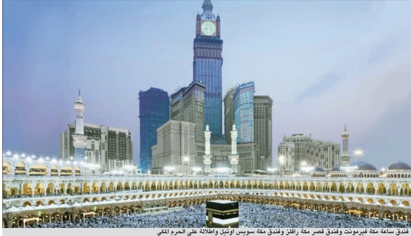
فندق ساعة مكة فيرمونت وفندق قصر مكة رافلز وفندق مكة سويس أوتيل وإطلالة على الحرم المكي

نجوم واكبر قاعة للمناسبات الكبرى والمؤتمرات وقد حصل فندق ساعة مكة - فيرمونت على جائزة «أفضل فندق جديد في الشرق الأوسط» من جوائز السفر العالمية لمنطقة الشرق الأوسط 2011.