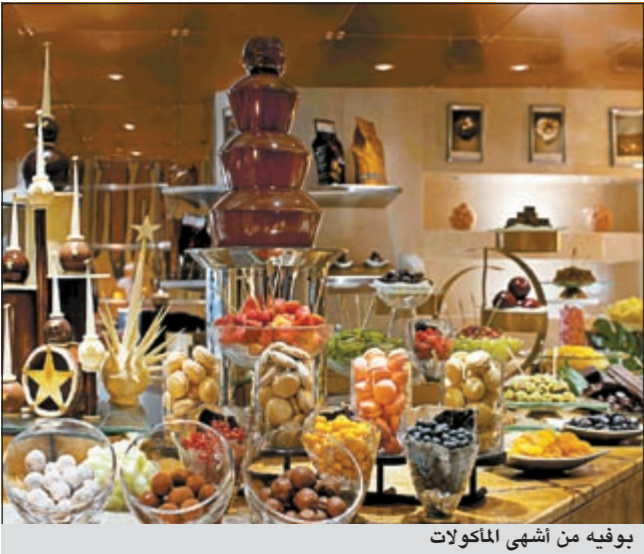
بوفيه من أشهى المأكولات

فندق ساعة مكة - فيرمونت منارة في قلب العاصمة المقدسة