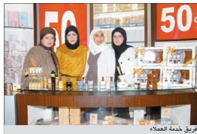
فريق خدمة العملاء

على جميع المنتجات الجديدة للشركة، وأوضح المرشود أن الشركة تستهدف إلى التوسع في أسواق المنطقة وخاصة الأسواق الخليجية من خلال افتتاح فروع جديدة وخاصة في الأسواق الخليجية النامية.