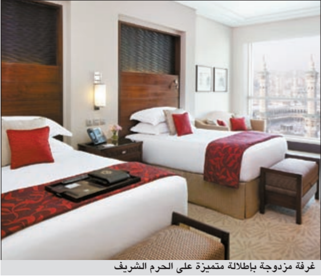
غرفة مزدوجة بإطلالة متميزة على الحرم الشريف