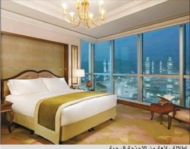
اطلالة رائعة من الأجنحة الرحبة

لاستضافة شتى أنواع المناسبات، يوفر الفندق ما تصل مساحته إلى 3.200 قدم مربع من المرافق للمناسبات الكبرى، بما في ذلك ثلاث صالات رائعة للحفلات وثمانية قاعات اجتماعات مجهزة بأحدث التقنيات، إضافة إلى مركز متكامل لخدمة رجال الأعمال.