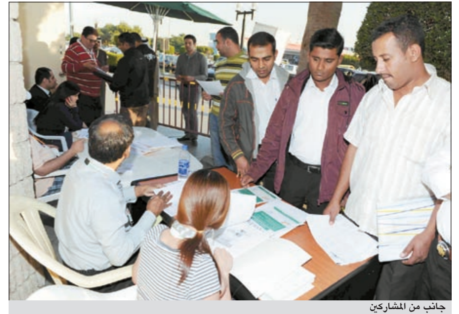
جانب من المشاركين

كبيراً من المتقدمين للوظائف قد حضر واللقاء مديري الموارد البشرية ومديري الأقسام الذين كانوا متواجدين على مدار اليوم لتقديم المعلومات حول كل الوظائف والإجابة عن جميع الأسئلة.