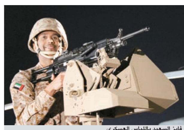
فايز السعيد باللباس العسكري

بيروت: تحت عنوان «سلام العزيا بلادي» اطلق سفير الاخوان الاماراتي فايز السعيد، أغنيته الوطنية المصورة الجديدة، التي انتهى من تصويرها بطريقة الفيديو كليب مع المخرجة الاماراتية نهلة الفهد، ضمن اجواء عسكرية خاصة تعاون بها مع القوات المسلحة الاماراتية الجوية والبحرية والبحرية الى جانب حرس القيادة، حيث استغرق التصوير ثلاثة ايام عمل. وكانت المفاجأة في الاغنية المصورة، هي ظهور فايز السعيد بمجموعة من الازياء العسكرية الخاصة بالقوات البرية والجوية كالمطيارين، وتم تصويره ضمن قواعد عسكرية وعلى جميع الاجهزة الحقيقية المستخدمة