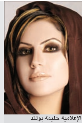
الإعلامية حليلة بولند