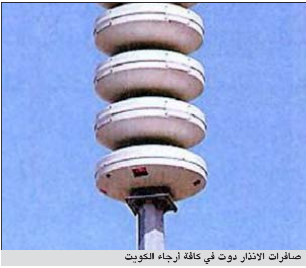
اصفارات الإنذار دوت في كافة أرجاء الكويت

اي ملاحظات من المواطنين والمقيمين. وأشارت الى انه تم تشغيل اللوحات الارشادية على الطرق السريعة قبل الانطلاق بمدة 24 ساعة وأثناء اطلاق صافرات الإنذار. قامت الادارة العامة للدفاع المدني صباح امس باجراء التشغيل التجريبي لاصفارات الإنذار حيث انطلقت 240 صافرة الكترونية ذات تقنية عالية تدور على قاعدة دائرية لا يصل النغمات بتردد ثابت، وصاحب اطلاق النغمات تسجيل صوتي للتعريف بمدلول النغمة وكذلك رسائل مسجلة باللغتين العربية والإنجليزية. كما قامت الادارة العامة للدفاع المدني بنشر فرق بجميع المحافظات للاستماع للصفرة وتسجيل اي ملاحظات عليها بالإضافة الى تلقي غرفة عمليات الادارة العامة للدفاع المدني