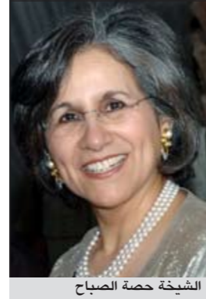
الشيخة حصة الصباح

ادارة مكون من خمسة اعضاء يتم اختيارهم بمعرفة الجمعية العمومية لمدة سنتين قابلة للتجديد لمدة سنتين تبدأ السنة المالية للمبرة في الأول من يناير من كل عام وتنتهي في آخر ديسمبر، فيما عاد السنة الأولى فتبدأ من تاريخ شهرها وتنتهي في آخر ديسمبر من العام التالي، وجاء في ملخص النظام الأساسي لمبرة الكويت للحضارات انه تم بوزارة الشؤون الاجتماعية والعمل تسجيل مبرة باسم مبرة الكويت للحضارات ومقرها مبرة لمدة غير محددة وذلك بهدف إقامة المشاريع والمراكز الثقافية والإعلامية والتعليمية التي تدعم مجموعة الصباح الأثرية وحماية منجزات الثقافة والفنون