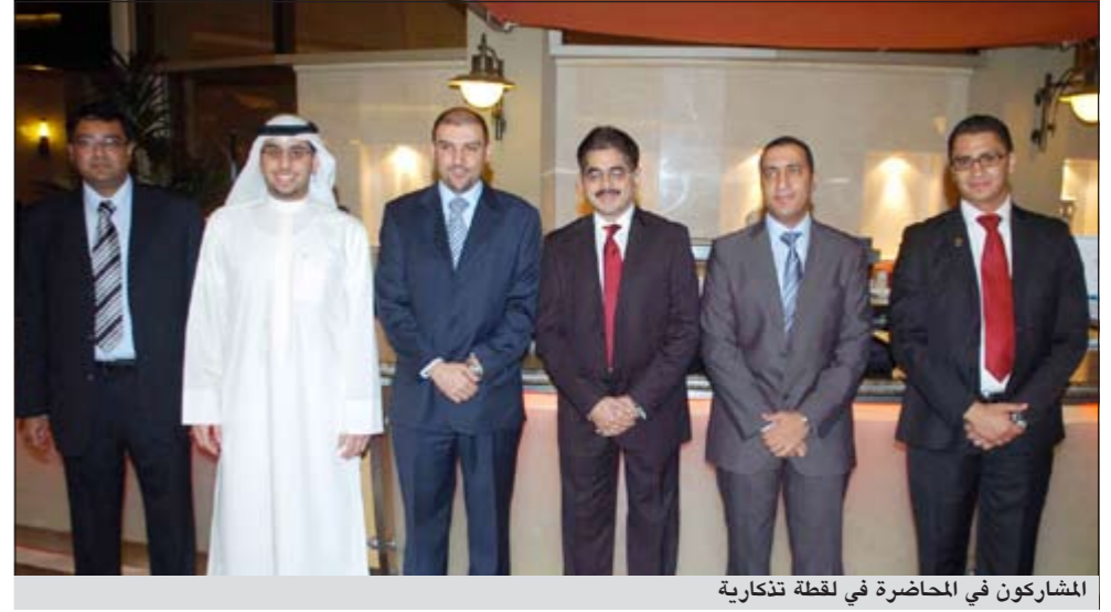
المشاركون في المحاضرة في لحظة تذكارية

تحتوي على مضخة دفع مياه ومضخة تدوير الماء الساخن من إنتاج «غراندفوس»، كما تقوم بالحرق حسب نظام «FM/UL» والتكيف للمشاريع الاستثمارية ومباني الدولة، وكذلك مضخات الآبار العميقة ذات الملوحة العالية لمخاطبات وزارة الكهرباء والماء ومضخات الحقق بجميع أحجامها واستخداماتها.