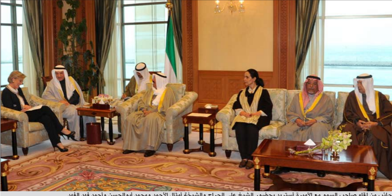
جانب من لقاء صاحب السمو مع الأميرة استريد بحضور الشيخ علي الجراح والشيخة أمثال الأحمد ومحمد أبو الحسن وأحمد فهد الفهد