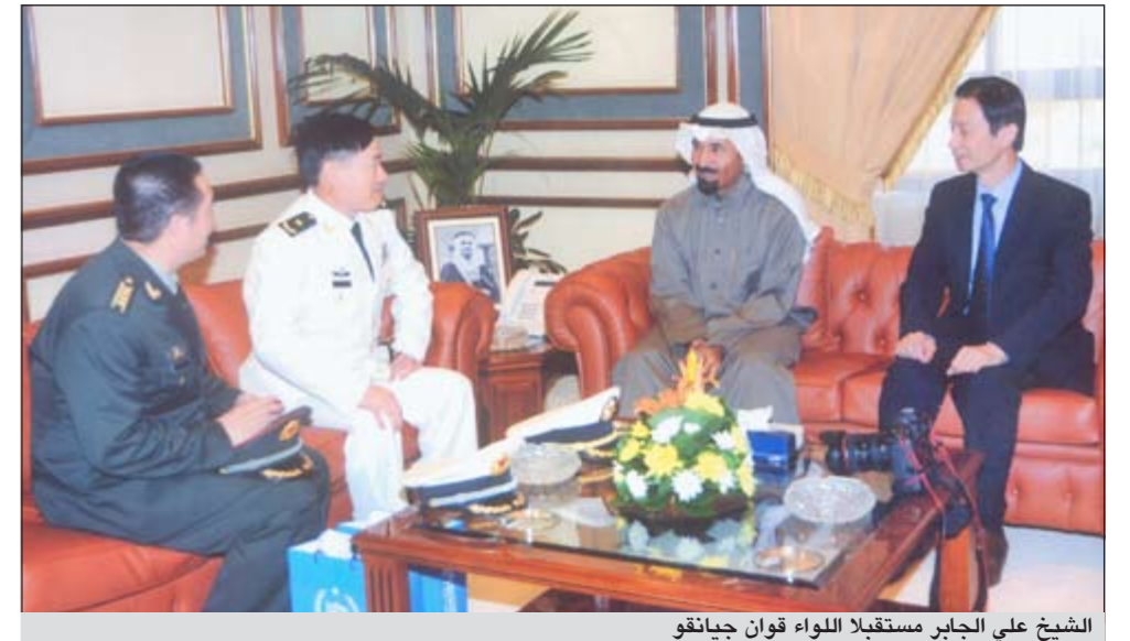
الشيخ علي الجابر مستقبلاً اللواء قوان جيانقو

زار قائد أسطول حراسة الملاحه للقوات البحرية الصينية اللواء قوان جيانقو يرافقه ضباط من القوة البحرية الصينية قاعدة محمد الأحمد البحرية وجالوا على معهد القوة البحرية وجمع الصيانة والوحدات القائمة والخاصة.