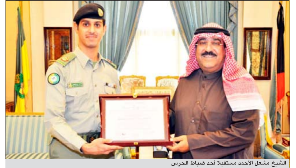
الشيخ مشعل الأحمد مستقبلاً أحد ضباط الحرس

أكد نائب رئيس الحرس الوطني الشيخ مشعل الأحمد اتاحة المجال أمام منتسبي الحرس الوطني للنهل من مختلف العلوم ومواكبة أحدث ما وصلت إليه التكنولوجيا لصفل خبراتهم والارتقاء بالأداء.