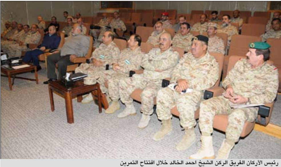
رئيس الأركان الفريق الركن الشيخ أحمد الخالد خلال افتتاح التمرين

إيجاز من هيئة الركن المشاركة في التمرين عن سيناريو التمرين والموقف العام والخطة الموضوعية للتعامل مع كل المعضلات، وذلك بمشاركة جميع الوحدات العسكرية والوحدات المشاركة والتنسيق من خلال العمل المشترك. وجرى مناقشة خطة التمرين وتبادل وجهات النظر حول أهم النقاط والمواقف التعبوية والدفاعية والتنسيق حول اظهارها بالشكل المطلوب وتنفيذ جميع مراحل التمرين بدقة واثقان. وحضر افتتاح التمرين نائب رئيس الأركان العامة للجيش الفريق الركن خالد الجراح ومجلس الدفاع العسكري.