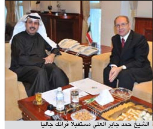
الشيخ حمد جابر العلي مستقبلاً فرانك جاليا

بحث وزير الإعلام الشيخ حمد جابر العلي مع سفير جمهورية مالطا المحال إلى الكويت فرانك جاليا سبل تعزيز العلاقات المشتركة بين البلدين الصديقين في شتى المجالات لاسيما الإعلامية. جاء ذلك خلال استقبال الشيخ حمد جابر العلي في مكتبه امس السفير فرانك جاليا الذي قدم التهنئة إلى وزير الإعلام بمناسبة توليه منصبه الجديد متمنياً له التوفيق والنجاح في خدمة وطنه.