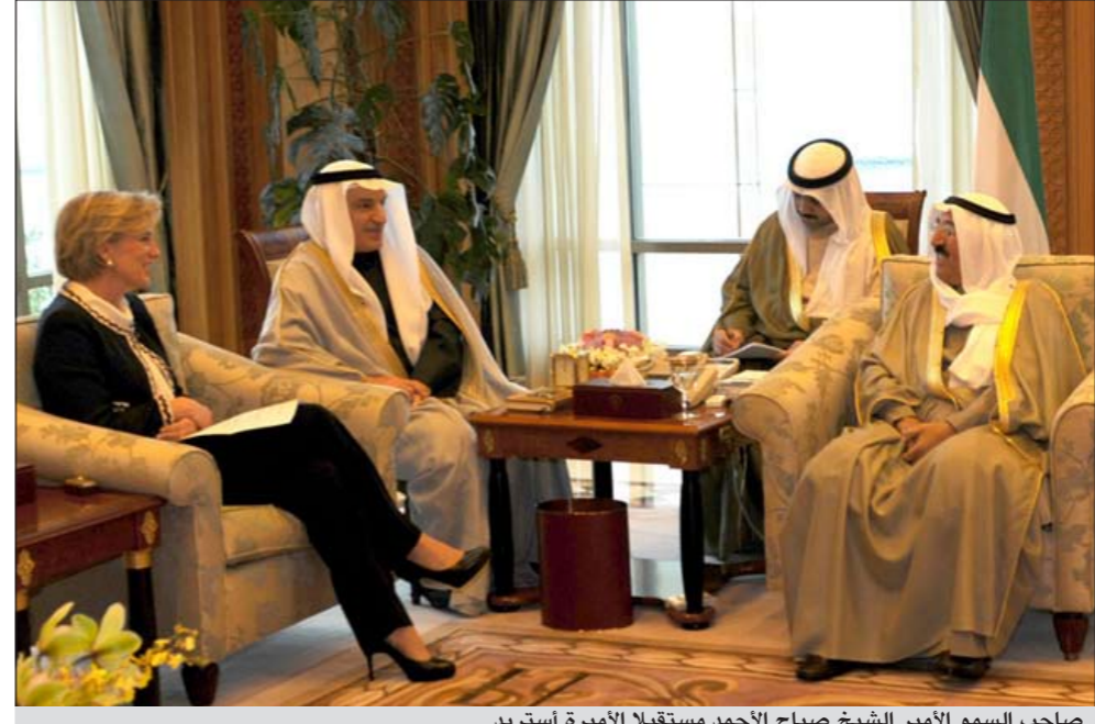
صاحب السمو الأمير الشيخ صباح الأحمد مستقبلاً الأميرة استريد

يتفضل صاحب السمو الأمير الشيخ صباح الأحمد فيشمّل برعايته وحضوره الحفل الختامي لتكريم الفائزين والفائزات في مسابقة الكويت الكبرى لحفظ القرآن الكريم وتجويد الخامسة عشرة وذلك في تمام الساعة العاشرة والنصف من صباح اليوم الأربعاء على مسرح المغفور له الشيخ صباح السالم في جامعة الكويت بالخالدية. إلى ذلك استقبل صاحب السمو بقصر السيف صباح امس صاحبة السمو الملكي الأميرة استريد أميرة بلجيكا الممثل الخاص لحملة المشاركة في مكافحة الملاريا والوفد المرافق وذلك بمناسبة زيارتها الرسمية للبلاد. حضر المقابلة نائب وزير شؤون الديوان الأميري الشيخ علي الجراح ورئيس مركز العمل التطوعي والشيخة أمثال الأحمد.