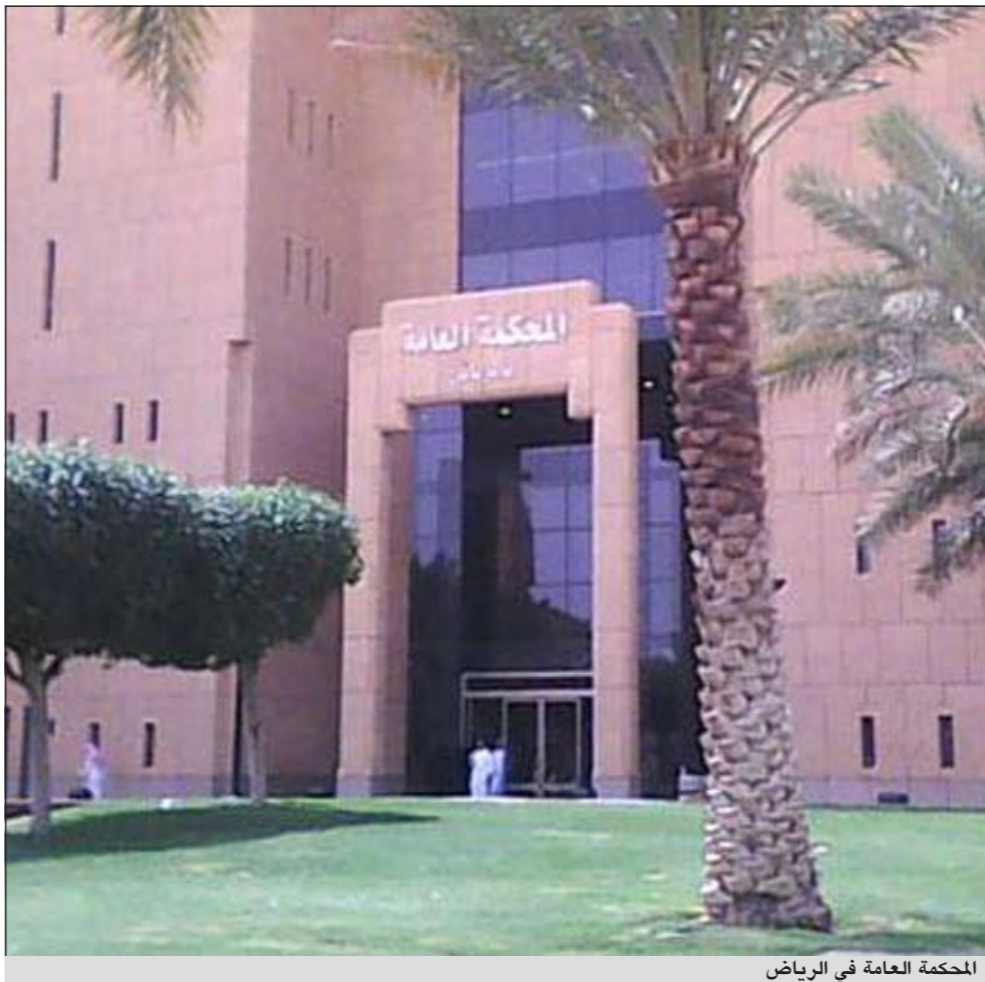
المحكمة العامة في الرياض

المعاملة أو العقوبة القاسية أو اللا إنسانية أو المهينة، والتي انضمت السعودية لها في العام 1997.