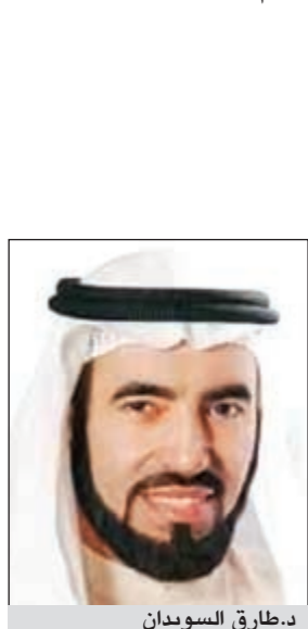
د. طارق السويدان

عضوية الكثير من الجمعيات العالمية ومنها جمعية التدريب والتطوير الأميركية وجمعية الإدارة الأميركية وجمعية هندسة النفط الأميركية، كما عمل استاذاً مساعداً في كلية الدراسات التكنولوجية بالكويت خلال الفترة من 1977 وحتى 2011 بالإضافة الى عمله مراقباً لهندسة المكائن في وزارة النفط الكويتية من العام 1975 وحتى العام 1977.