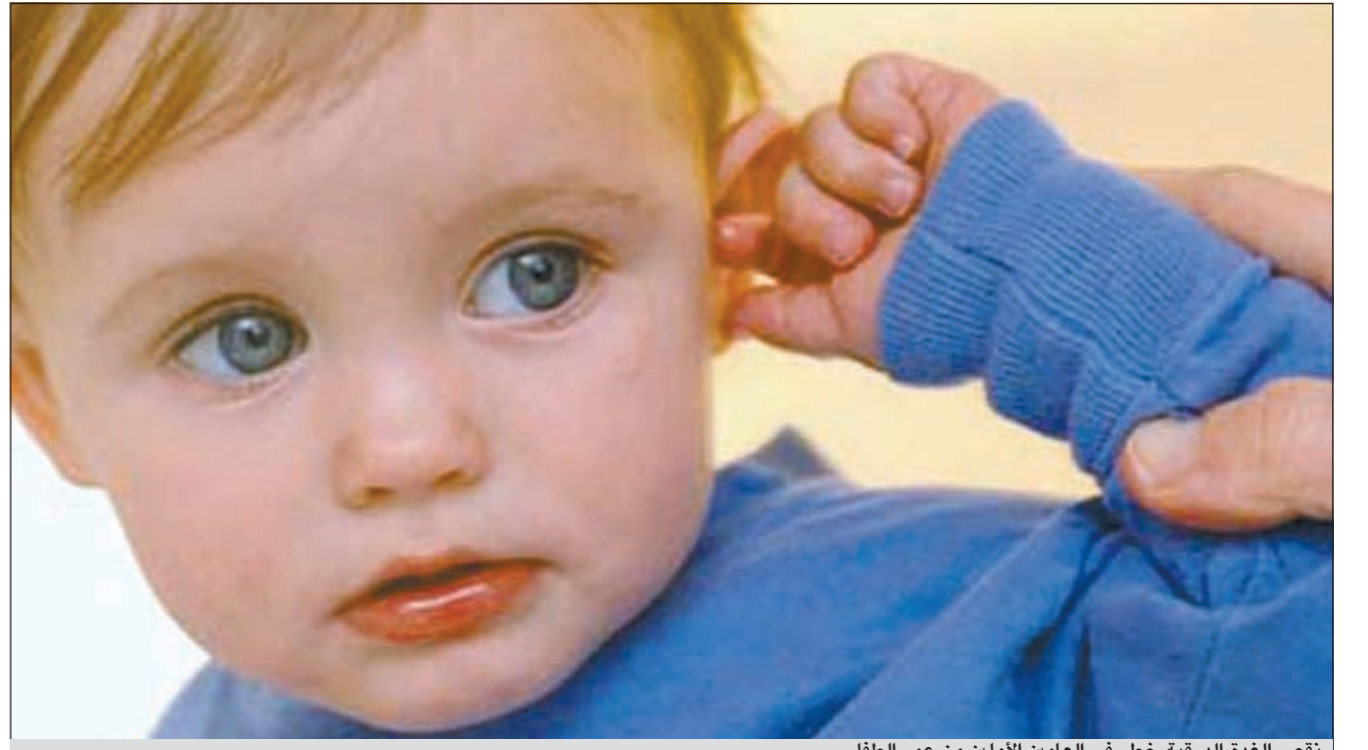
نقص الغدة الدرقية خطر في العامين الأولين من عمر الطفل