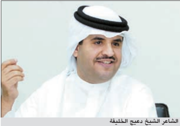
الشاعر الشيخ دعيج الخليفة

وعن جديده قال النجم طارق العلي: مازلت استعد لتصوير الجزء الثاني من مسلسل «الفلانة» والذي سيرعرض في شهر رمضان المقبل، ومن المتوقع مشاركة معظم أبطال الجزء الأول، إضافة إلى انضمام ممثلين جدد، سيتم الإعلان عنهم قريباً. يشار إلى أن الفنان فيصل الخرجي سيعقد اليوم «الثلاثاء» في الساعة والنصف مساءً بفندق هولندي أن مؤتمراً صحافياً تحت رعاية الخليفة بمناسبة طرح ألبومه الجديد «يا بنية».