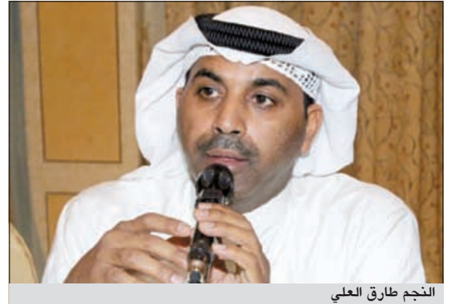
النجم طارق العلي

عندي لمساعدة كل شاب كويتي صاحب طموح في مجال الفن، لافتاً إلى أنه طلب من الخرجي وضع «ستاند» لعرض ألبومه وبعبه أثناء تقديم مسرحيته الكوميدي «طرطنقي» بميدان حولي وذلك من دون أي مقابل، وأن الجمهور أقبل على الألبوم وأعجب به. وفي السياق نفسه، رفض النجم طارق العلي أن يتم تحميل الدولة عبء دعم الفنانين الشباب وقال: لدينا الكثير من الشركات الخاصة التي يجب أن تساهم في صناعة المواهب المحلية ووضعها على الطريق الصحيح، لاسيما أن الدعم الديرية مليئة بالفنانين الشباب الذين يحتاجون لمن يقف